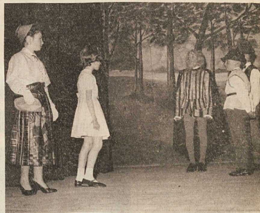
Solska prireditev v Križu. Na sporedu je bila tudi mladinska igra »Princesa in pastirček«