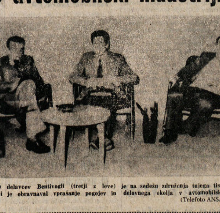
Generalni tajnik zveze kovinarskih delavcev Bentivogli (tretji z leve) je na sedežu združenja tiska med tiskovno konferenco, na kateri je obravnaval vprašanje pojavev in delovanja okolja v avtomobilski industriji