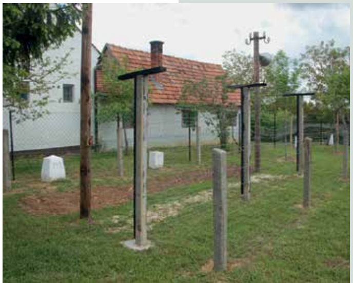
Muzej železne zavese v Števanovcih.