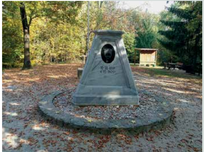
Tromejni kamen iz leta 1924.

Muzej »železne zavese« v Števanovcih (Apátistvánfalva) je edinstven v Evropi, živi pričevalec obdobja hladne vojne, vsekakor vreden ogleda – v spomin in opomin. Osnovni namen železne zavese je bil preprečiti beg ljudi iz komunističnega tabora v razviti, svobodnejši svet. Po petnajstih letih, ko je demokratična madžarska oblast dala odstraniti »železno zaveso« in jo danes zaraščajo trave in grmičevje, je ta mrtvi pas še viden, toda narava ne pozna meja. Danes ta pas zarašča grmičevje in gozdno drevje in na njem se ustvarja edinstven habitat različnega rastja, ki je dobilo že institucionalno formo z imenom Evropska zelena vez, ki je dolga 6800 km in poteka skozi 23 evropskih držav ter je najdaljši sistem habitatov v Evropi. V Sloveniji poteka po meji z Italijo, Avstrijo in Madžarsko v dolžini 650 km. Ljudje na tem območju hranijo v spominu številne zgodbe, ki so zaznamovale tako njih kot način življenja v teh krajih.