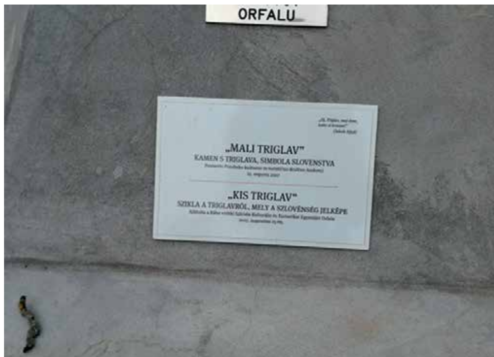
Mali triglav – Andovci, Orfalu, simbol slovenstva v Porabju.