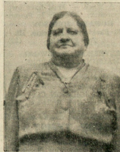
BLAG SPOMIN DESETE OBLETICE SMRTI NAŠE DRAGE MAME IN STARE MAME

Prva skupina (21%) je za takojšen umik, druga skupina (25%) je za umik v 18 mesecih.