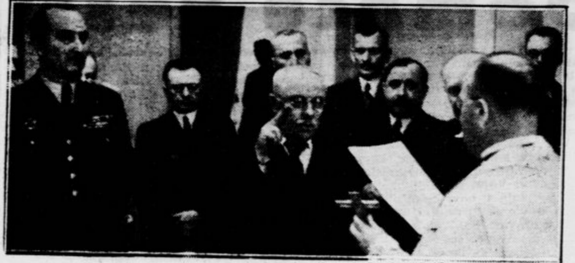
Prisega prvega podpredsednika vlade dr. Mačka