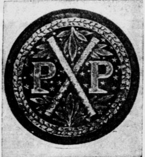
Žig državnega predstavitelja Francije, maršala Petaina