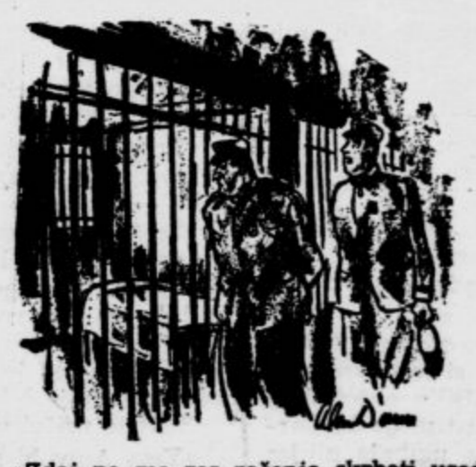
»Zdaj pa me res začena skrbeti usoda kaznjenca št. 9386. Njegova postelja je popolnoma prazna...«