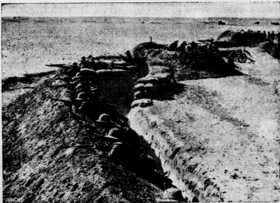
Tudi v puščavi se vodijo borbe na okopih