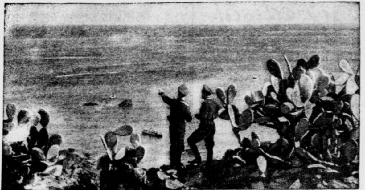
Dva nemška letalca na obali Južne Italije