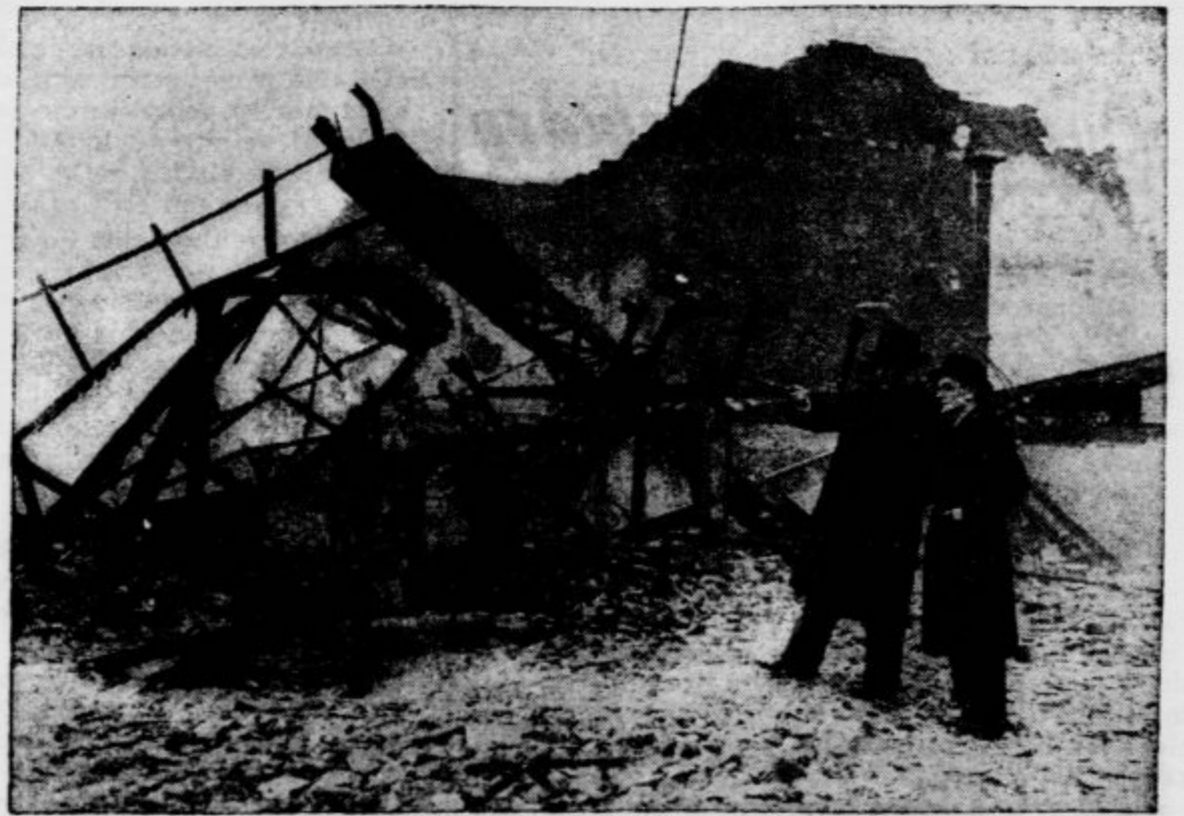
Avstralski min. predsednik Menzies (s palico v roki) ogleduje v družbi londonskega župana razvaline v angleški prestolnici