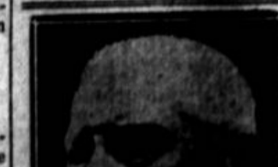
Nemški prezident Hindenburg je danes nekaj diktator, ki pa najbrž ne bo dolgo.