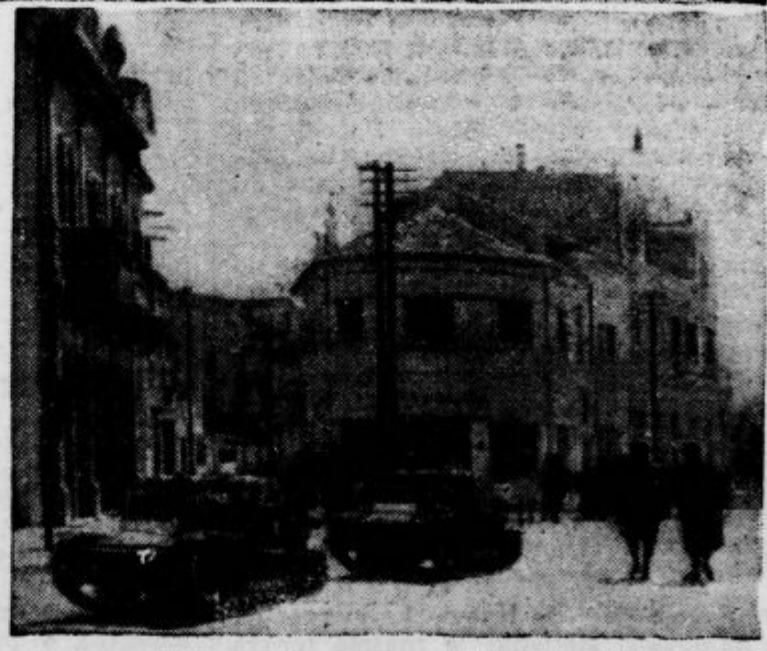
Levo zgoraj: Izkrcanje italijanskega vojaštva z ladje »Savola« v Draču — Spodaj: Grof Ciano po prihodu v Tirano, obdan od članov albanskega odposlanstva — Desno zgoraj: Beg albanske družine iz Skadra. Albanec je od otroških nog puška najvernejša tovarišica — Spodaj: Tanki v Draču