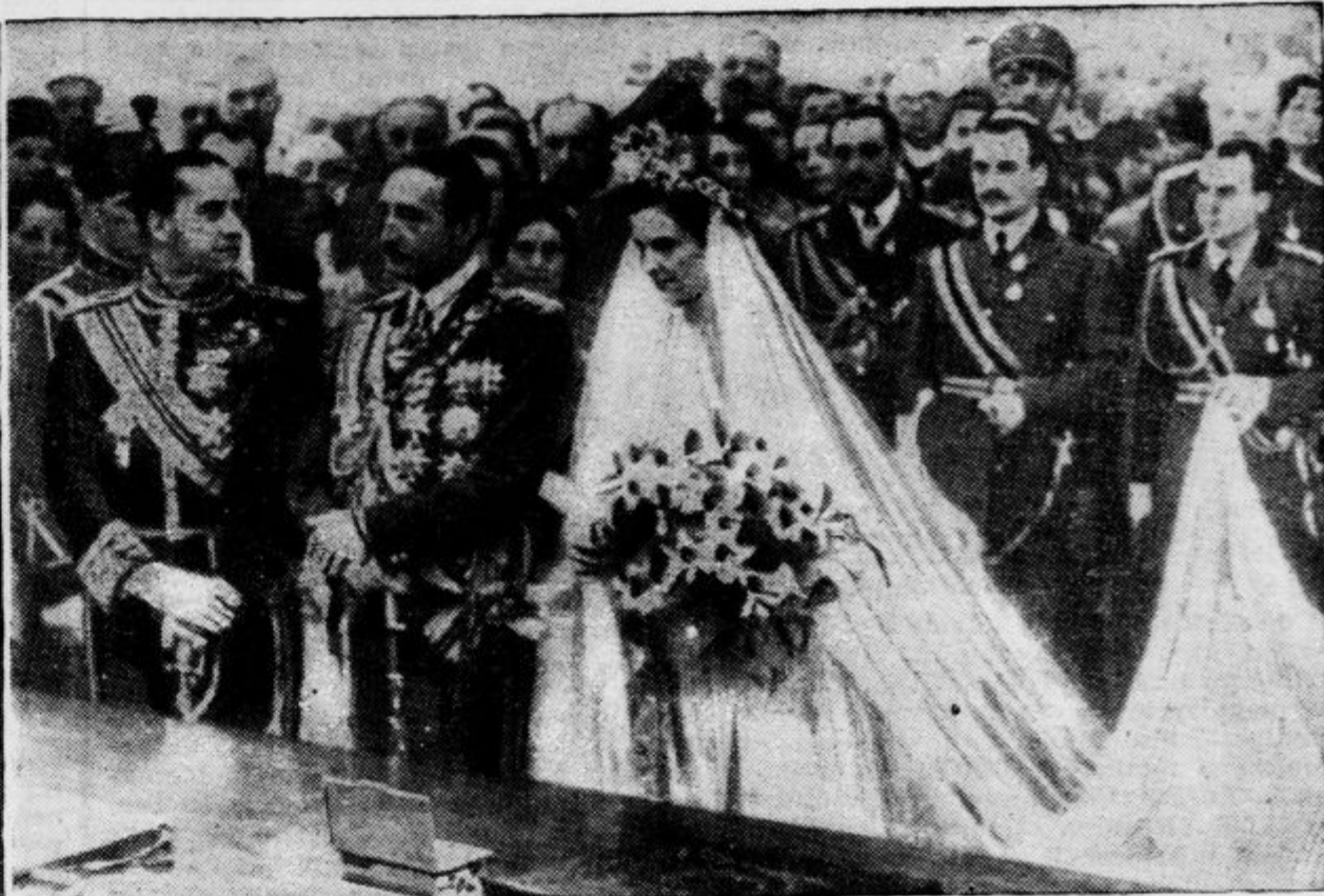
Poroka kralja Zoga z grofco Geraldino Appony. Poleg albanskega kralja stoji grof Ciano

Pomorski promet vzdolž albanske obale je bil izključno v italijanskih rokah. Albanija ima samo eno jahto, in še to je italijanski kralj in cesar poklonil kralju Zogu ob 25-letnici neodvisnosti albanske države. Na kopnem se vrši promet po Albaniji z avtomobili, ki so last Albancev, toda italijanskega izvora. Letalski promet je imela v rokah Italija. Aeroplani so vzdrževali posebno promet na progi Tirana-Bari, ladje pa so vozile med Barijem in Dračem.