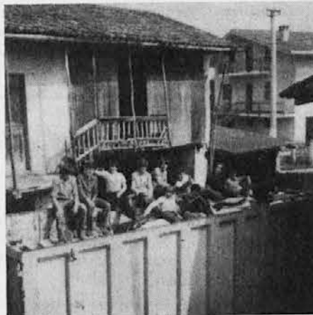
Sovodnjski skavti so napolnili kontejner (zabožnik) z nabranim papirjem