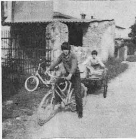
Dva sovođenska mladınca ob pobiranju papirja za novogoriško cerkev

kar so imeli, in celo vozili so star papir iz mesta, kjer delajo.