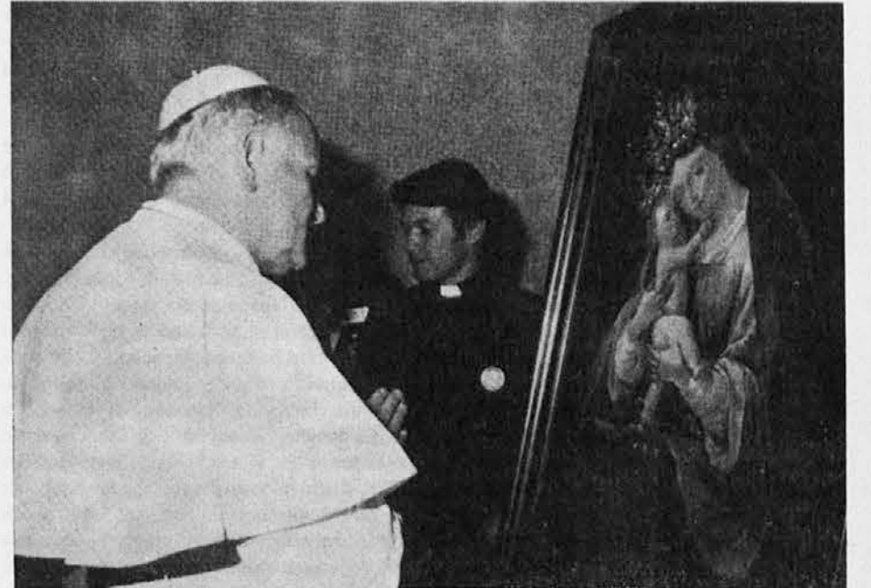
Janez Pavel II. pred sliko Marije Pomagaj z Brezij, ki jo je okronal 18. oktobra 1979 in je izpostavljena v zavodu Slovenik v Rimu

Prve dni v juniju bi moral obiskati Švico tudi sv. oče. Tamkajšnji katoličani so se tega obiska zelo veselili in nanj zavzeto pripravljali. Atentat na trgu sv. Petra pa je ta obisk preprečil.