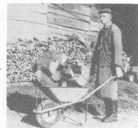
Pred zimo je treba misliti predvsem na kurjavo