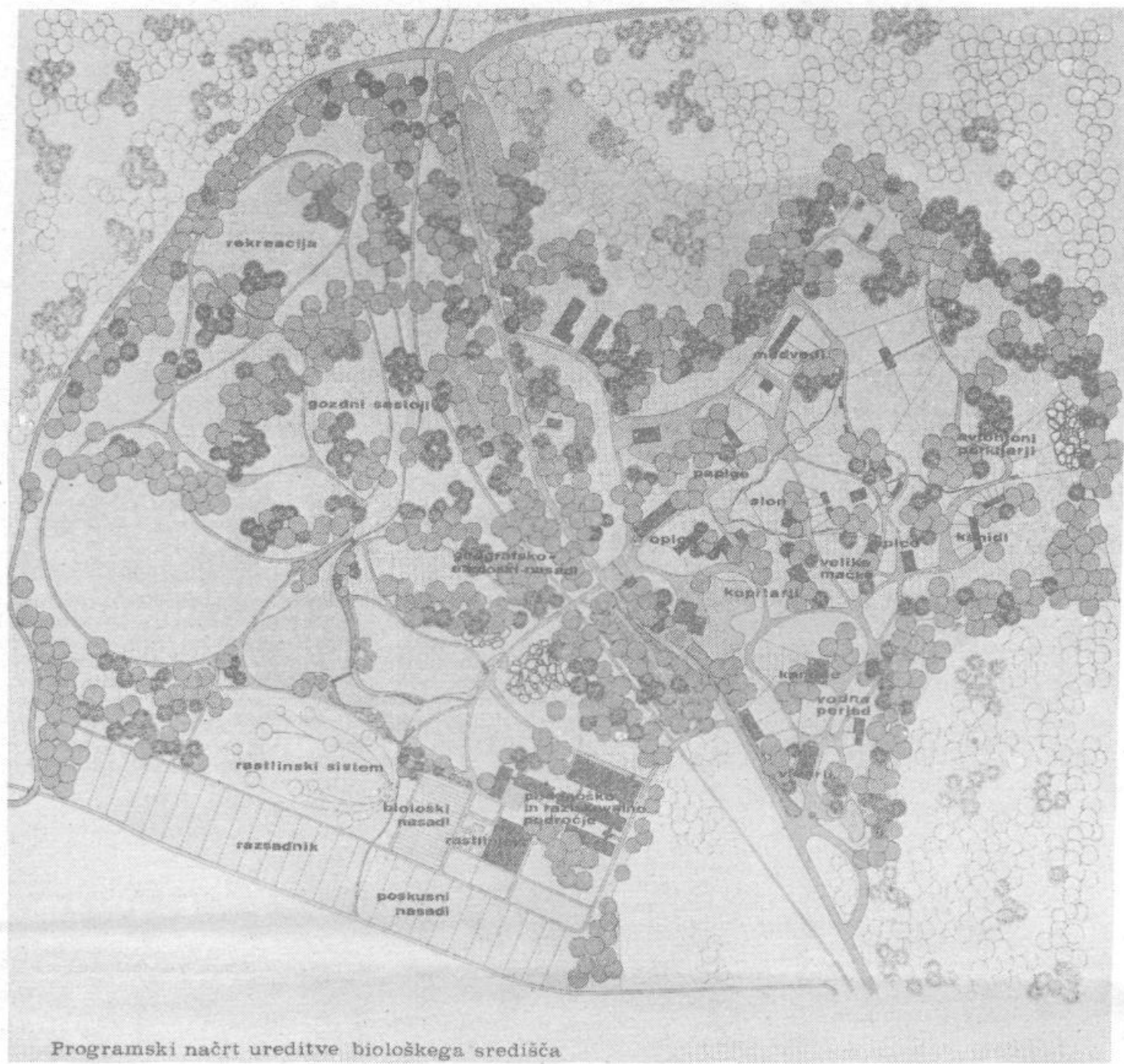
Programski načrt ureditve biološkega središča

Trenutno je odkupljena 17 hektarjev zemljišča. Lani (1985) smo ob 175-letnici nepretrganega delovanja sedanjega botaničnega vrta že tudi začeli prva dela, namenjena preselitvi starega botaničnega vrta z Ižanske ceste ob Večno pot. Ob pomoči univerze in dveh ljubljanskih občin, ki pri