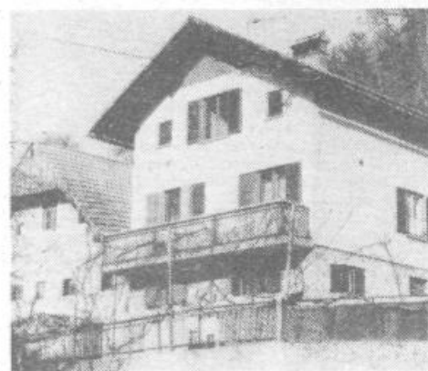
Z marjivim delom si vse več hiš nadeva lepšo, sodobnejšo obliko

Tistim, ki se vozijo na delo v Ljubljano, seveda ne more biti preveč lahko. Vstajati morajo ob 4.00 zjutraj in iti do najbližje avtobusne postaje bodisi v Zalogo, bodisi na Briše. Za tiste, ki so bliže Briskam, je še toliko težje, ker imajo od tam en sam avtobus na dan v Ljubljano in enega nazaj. Nasploh je kraj zelo raztresen in tako so pač tudi avtobusne veze za nekatere boljše, za druge pa slabše.«