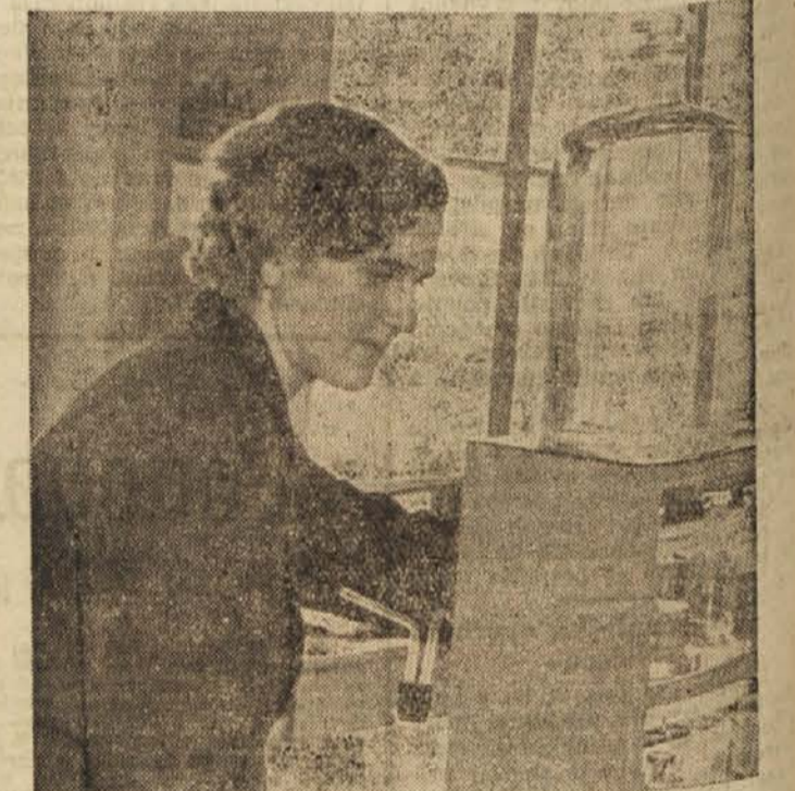
V tovarniškem laboratoriju

oprema in licenca bi stala 160.000 nemških mark. Pri uvozu tesnil pa bi prihranila naša država letno 285.000 dolarjev, kajti izdelovalci bi vsa tesnila, ki jih potrebuje naše gospodarstvo in sicer tesnila, odporna do 600 stopinj Celzija temperature in do 100 atmosfer pritiska. Sedanje poslopje tovarne ni primerno. V njem nimajo niti vede niti primernih sanitarnih priprav. S pomočjo okraja, ki vidi potrebe tovarne, so letos zgradili skladišče. Začeli pa so tudi že graditi kotlarno in obratne delavnice. Graditi pa bodo začeli tudi upravno poslopje, v katerem bodo poleg drugega tudi vse sanitarne naprave.