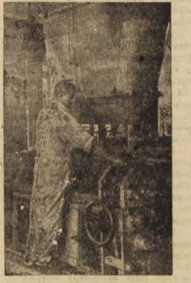
Stroj za gnetenje »PAROLITA«

Pod jezom nove medvoške elektrarne, na bregu Save, stoji tovarna tesnil in plastičnih mas »TESNILKA« Medvode. Podjetje so ustanovili leta 1947, da bi proizvajali