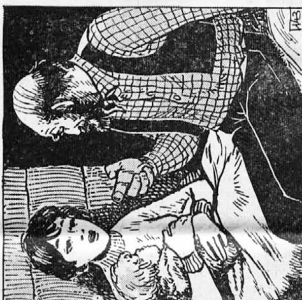
143. Mož ji je postregel s čajem in Jeanne so se vrnile moči. Strah ji je vztrepetal v očeh, ko se je domislila prestanih strašnih ur. Potem je začela pripovedovati tujcu. Kazan se je pomirjen in zadovoljen zavlekel pod posteljo. Odvzeto mu je bilo breme, pod katerim ni smel omagati. Utrujene oči so se mu zaprle.