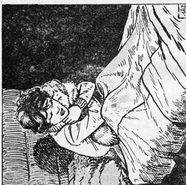
142. Oči so ji begale po neznanem prostoru, po neznanu in po Kazanu, ki se je dvignil in s prijaznim renčanjem stopil k njej. Končno je zagledala krzneni sveženj, v katerem je ležal otrok. Z veselim krikom ga je dvignila v naročje in vedno znova poljubljala mali obraz ter rdeče ročice. Zadišalo je po vročem čaju.