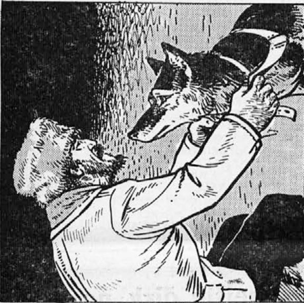
140. Čez nekaj trenutkov se je še enkrat vrnil, stopil k psu in ga pogledal. Kazan je dvignil glavo in ga opazoval. Mož ni bil več mlad, pa tudi tako star, kot je bil Pierre Radisson, ni bil. Pretresen je vzkliznil: »In ti si to naredil popolnoma sam?« Brez strahu se je sklonil, ga odvezal in odvedel v hišo.