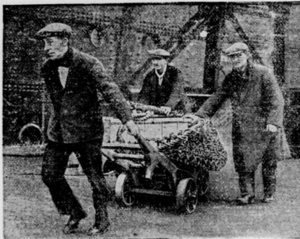
Anglija je izročila ameriški vladi dne 15. decembra zapadli obrok vojnih dolgov. Na sliki vidimo moža, ki pelje zlato v palcah na ladjo »Majestic« v southamptonskem pristanišču.