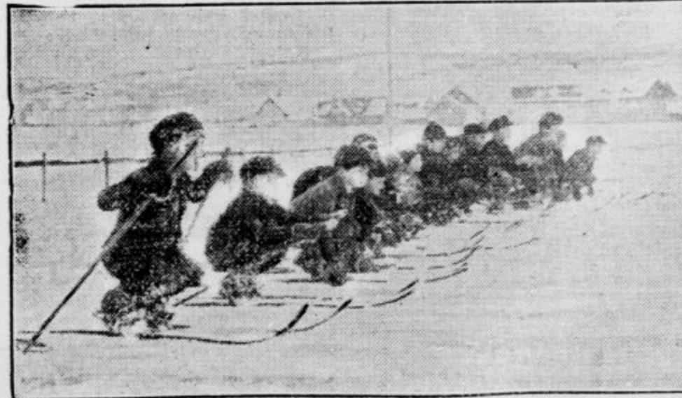
Otroci pri smučarskem veselju