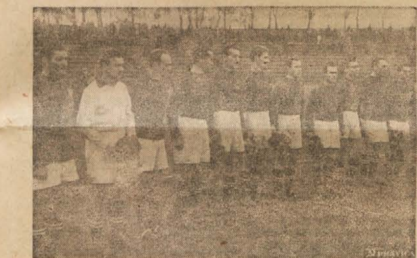
Enajstorica Beograda, ki je v soboto premagala ljubljansko reprezentanco s 3:0.

Vremenska napoved za torek 4. novembra: oblačnost in možnost manjših padavin, popoldan izboljšanje.