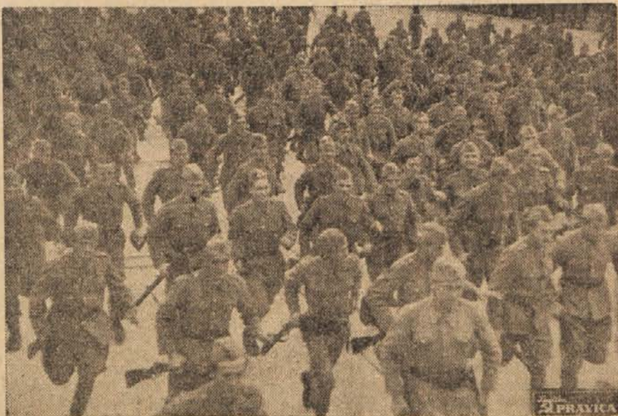
Ob proglasitvi domače armade za vsearmadnega prvaka v fizikulturi so borci domače armade tekmovali v krosu v vojaški obleki. Slika prikazuje tekmovalce na 2000 m po startu na Kongresnem trgu.

Svečanost je bila zaključena s predstavo Gotovčeve opere »Ero z onega sveta«.