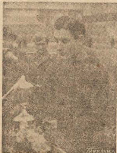
Najboljši igralec in od FISAJ-a pohvaljeni fizkulturnik Rajko Mitič je prejel od ljubljanskega moštva Lep pokal.

Beograd, 3. nov. Maršal Jugoslavije Josip Broz - Tito je podaril prehodni pokal, ki je določen za zmagovalca v tekmah za nogometni pokal Jugoslavije, razen tega pa tudi plaketo za zmagovalno ekipo, ki bo ostala njena trajna lastnina. Ta plaketa nosi relief pokala. Ta pokal, darilo najvišjega voditelja, maršala Jugoslavije Josipa Broza - Tita, bo prispevalo k boljšemu razvoju naših nogometnih tekmovalj, obenem pa k ogromnemu razvoju našega fizkulturnega gibanja. V letošnjih tekmah sodeluje nad 340 nogometnih moštev.