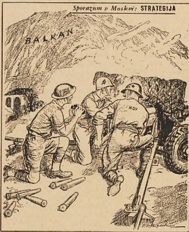
Sporazum v Moskvi: STRATEGIJA

Razgovori so potekali z znanjem in odobrenjem vlade Združenih držav, ki jo je zastopal ameriški veleposlanik v Moskvi, M.Averell Harriman, kot opazovalec".