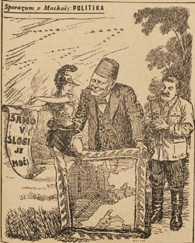
Sporazum v Moskvi: POLITIKA

London, 27. (REUTER). — Radio Svobodna Jugoslavija je danes objavil uradni komunike, v katerem je rečeno, da se razgovori med maršalom Titom in dr.Ivanom Šubašičem, predsednikom londonske vlade, ki so pričeli v sredo, glede popolnega edinstva Jugoslavije, razvijajo v pristrčni atmosferi. Komunike izraža upanje, da bo dosežen popoln sporazum glede sestave združene jugoslovanske vlade že v najkrajšem času.