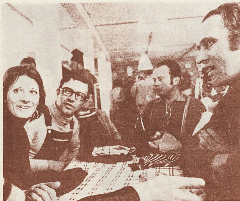
Utrujeni, vendar nasmejani