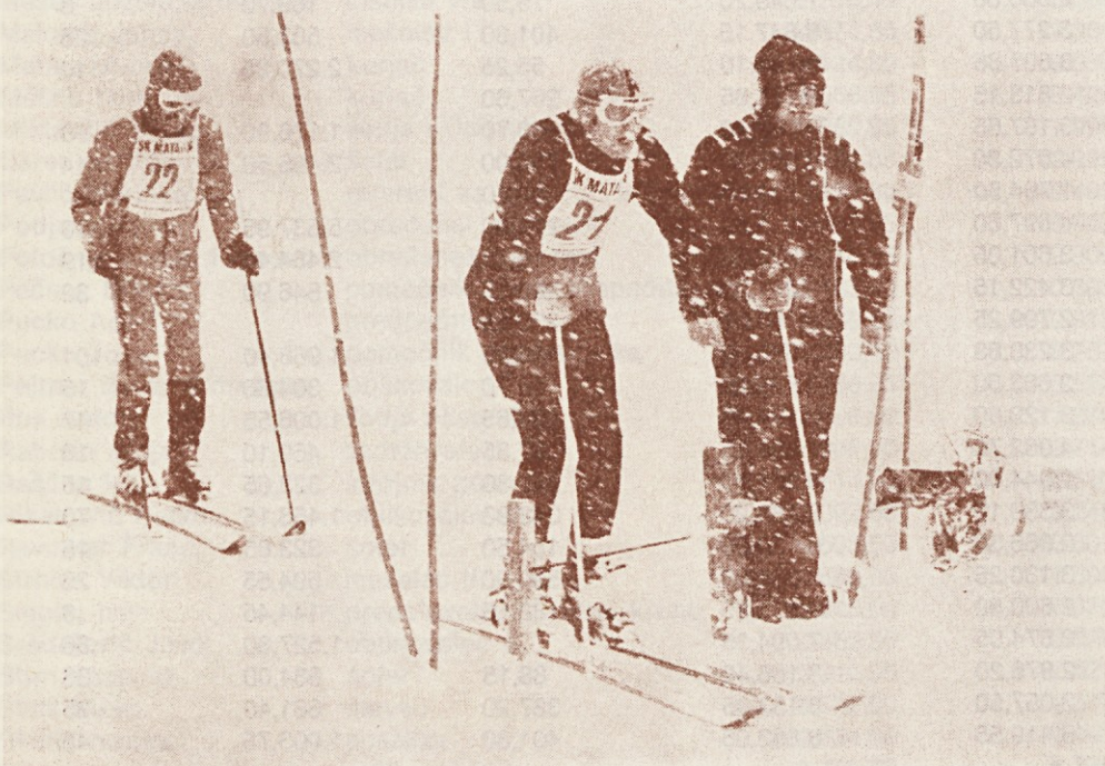
Pogoji so bili res težki

Glede analitične ocene ne bi dodala nič, lahko pa izrečem veliko kritiko glede dobave naših artiklov. Mislim predvsem na izdelke TOZD Šumi. Na primer iščemo proizvode, ki gredo dobro v prodajo, a jih kljub večkratni intervenciji, ne dobimo. Zgodilo se je, da smo morali izdelek TOZD Šumi kupiti pri Mercatorju. To vsekakor izraža slabe odnose med TOZD. Večkrat tudi vidimo naše nove artikle veliko prej v drugih trgovskih hišah, kot pri nas. Tako smo pogosto prisiljeni nabavljati blago pri konkurenčnih proizvajalcih. Prepričana sem, da moramo svojo trgovino, če jo že imamo, oskrbovati predvsem s svojimi izdelki. S tesnejšo povezanostjo med TOZD bi zagotovo odpravili številne pomanjkljivosti.