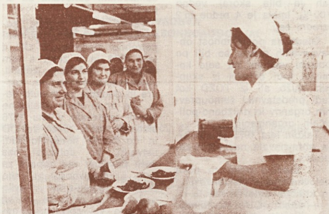
S prehrano še nismo vsi zadovoljni

Pri sprejemanju večjega odstotka iz bruto OD bi morale družbeno-politične organizacije odigrati pomembno vlogo in dati vso podporo da pride do čim hitrejše realizacije.