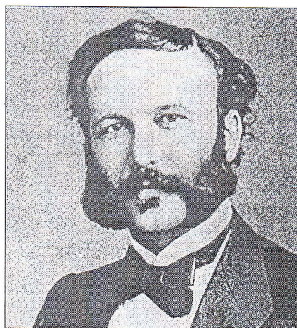
Slika 1: Henry Dunant (1828–1910), ustanovitelj Rdečega križa in prvi Nobelov nagrajenec za mir.

krvavem spopadu je padlo ali bilo ranjenih 40.000 mož. Kot vedno dotlej tudi tu ni bilo skoraj nobene pomoči ranjenim. Poslovnež, ki je slučajno prišel mimo, se je odločil prostovoljno pomagati. Trpljenje, ki ga je videl, ni spremenilo le njegovega življenja, ampak tudi vedenje do ranjencev po vsem svetu. Ta poslovnež je bil Švicar Henry Dunant.