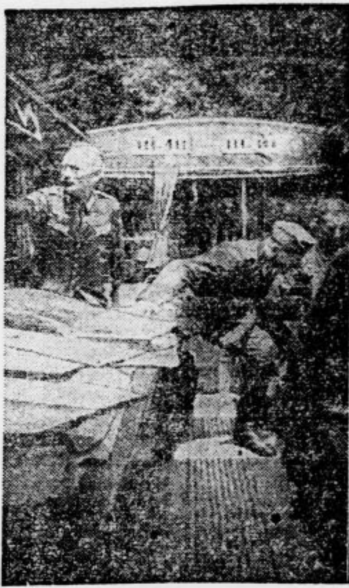
Osrče bitke: nemško divizijsko poveljstvo v železniškem vozu

»A katere ste že pogrešali?« je odgovoril pisatelj sočutno.