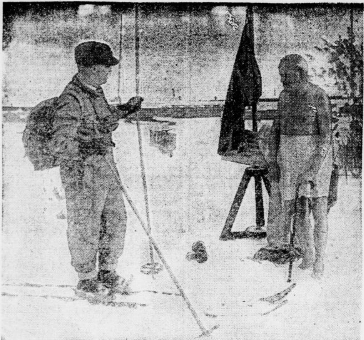
V Berlinu zbuja pozornost možak, ki kaže popolno neobčutljivost za mraz. Tu ga vidimo, ko se po vsakdanji snežni kopelici suši na soncu