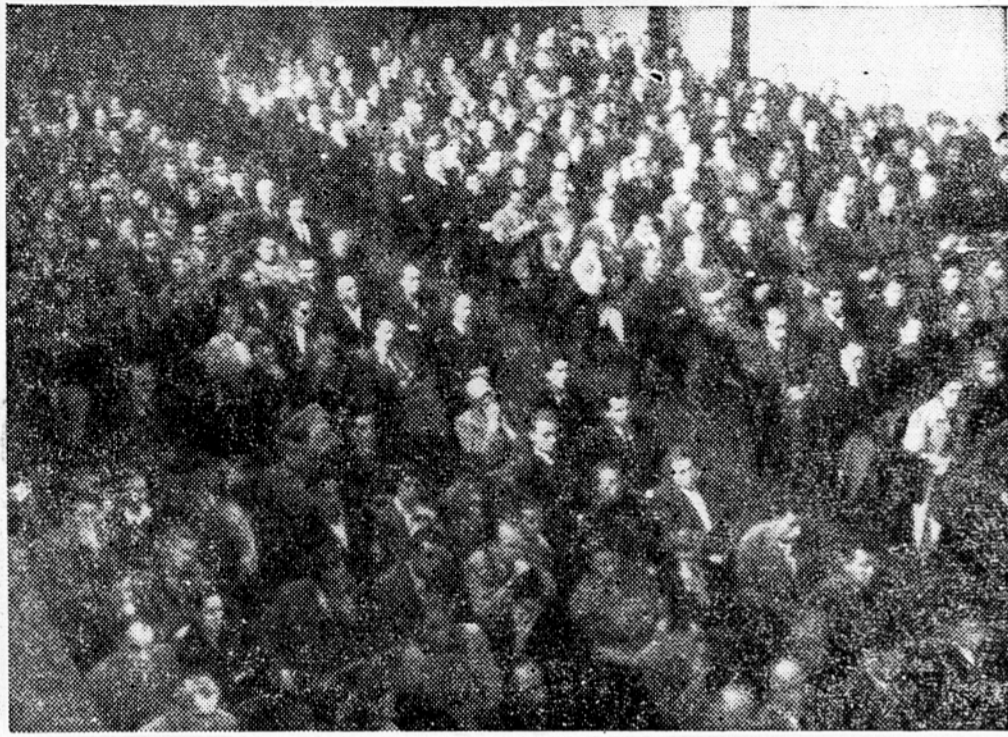
Pogled na zbrane delegate v veliki Unionski dvorani