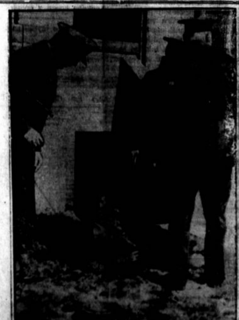
Policijski napad na brezposelne v Washingtonu. V tem se "new deal" nič ne razlikuje od starega.

Prav tako ne zagovarja ga! Zagovarjanje ekonomizma bi bilo tako neismiselno, kakor kdo zagovarjal štiri leta v zmernej pasu s konanim dobrim in slabim nem. Mi le opozarjamo stva, ki so dokaz, da ekonomski determinizem je, pa je prav ali ne.