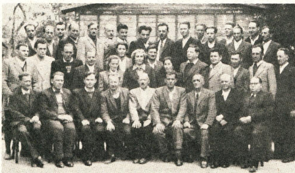
Prvi delavski svet tovarne Titan

Če za koga lahko rečemo, da mu pravica odločati o svojem delu in rezultatih dela ni bila