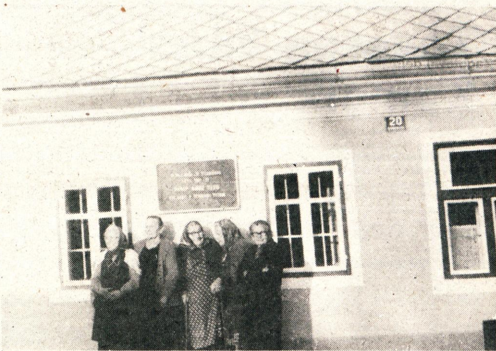
Najstarejše občanke Perova, fotografirane pred Beštovo hišo, v kateri je v letih 1911/12 stanoval predsednik Tito.