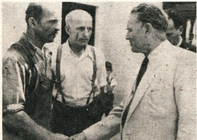
Predsednik Tito se je ob vsakem obisku v Titanu pozdravil s svojimi nekdanjimi sodelavci