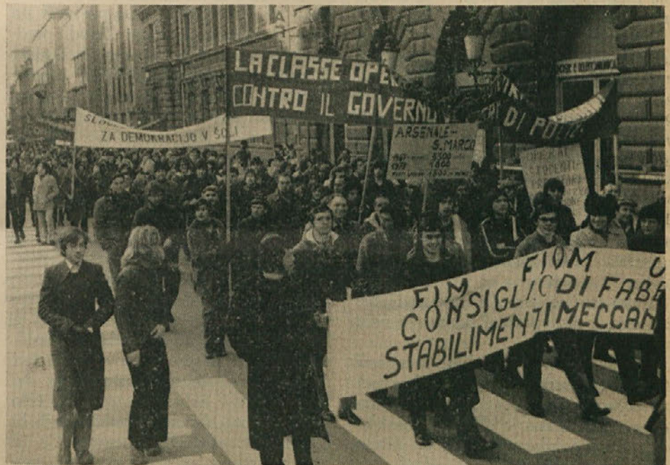
Dne 12. t.m. je bila vsedrjavna splošna stavka. Milijoni delavcev so demonstrirali proti vladi zaradi neizpolnenih reform. Tudi v Trstu in v drugih krajih dežele je stavka povsem uspela. V Trstu je delavski sprevod skušala motiti skupinica mladih fašistov. Ti so proti manifestantom izstrelili eksplozivno petardo. Policija je aretirala nekatere provokatorje. Na sliki skupina študentov, ki se je udeležila delavskega sprevoda.