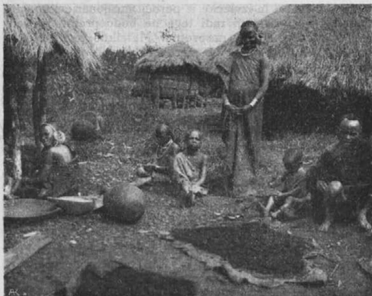
Krščanska družina Kikujev v misijonu Mangu (vikarijat Zanzibar).