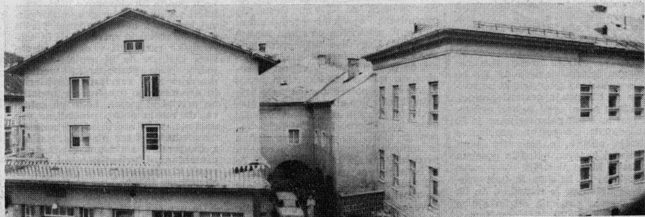
SEDANJE STANJE NA ISTEM MESTU: HOTEL SAVINJA — POSEBNA SOLA