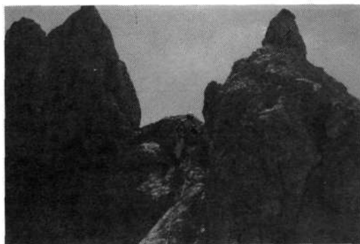
Od škrbine med Malim Oltarjem in Oltarčkom je prvi resnejši raztežaj III. težavnostne stopnje.