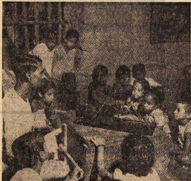
V Indiji je zelo razširjena malarija. Na sliki vidimo skupino šolskih otrok, kako jim zdravnik govori o nevarnostih malarije. Sredi med njimi je na podstavku postavljena komar antopheles, ki s svojim pikom prenaša klice te bolezni. V bližini New Delhija postavljajo podjetje, ki bo proizvajalo prašek DDT. Le-tega uspešno uporabljajo pri uničevanju komarjev in drugega mrčesa.