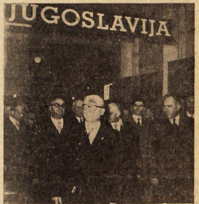
Na milanskem velesojmu si je naš paviljon ogledal tudi italijanski ministriški predsednik Antonio Segni

Bližnjem vzhodu, da bodo spoštovale določbe sporazuma o premirju in preprečile nadaljnje incidente. Sporazumi o premirju so bili sklenjeni med vojaškimi poveljniki prizadetih držav in so bili dvostranskega značaja ter na nižjem nivoju. Najnovejše obljube Izraela in arabski držav o prekinitvi sovražnosti pa ima Hammarskjöld za obljube, ki so jih dale posamezne države. Zato je