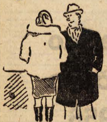
»Ta film sme gledati tudi mladina.« »Vi ste nepopoljšljiv laskavec.«