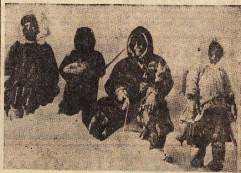
Generalni guverner Kanade je na svojem obisku v severozahodnih predelih te države obiskal tudi eskimska plemena. Na sliki ga vidimo, kako s eskimskimi otroci lovi ribe. Seveda so morali pred tem v led izvrti luknjo.

snemala razne hitrosti iz višine. V njej bodo lahko preizkušali motorje v enakih okoliščinah, kakor da leti letalo 21.356 m visoko s hitrostjo 2414 km na uro. Plini, ki bodo izpuhtevali iz motorjev, se bodo ohlajali v dveh etapah. V glavni kompresorski napravi bo pet drugih kompresorjev, s katerimi bodo potiskali pline iz celic za preizkušanje.