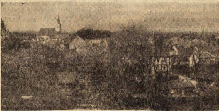
Pogled na Ljutomer