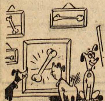
Na pasji razstavi