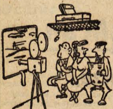
»Moj mož je zelo napreden. Pokrajino si rajši ogleda potem doma na filmskem platnu.«