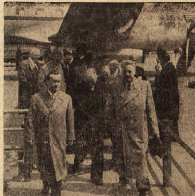
Ob sprejemu delegacije sovjetskih jedrskih znanstvenikov na zemskem letališču

Včeraj je bila seja Izvršnega sveta LRS pod predsedstvom Borisa Kraigherja. V zvezi z novim zakonom o upravnih organih LR Slovenije je Izvršni svet razpravljal o potrebnih ukrepih. Sklenjeno je bilo, naj bo rok za prenehanje odpravljenih in za začetek dela novih republiških organov 1. junij t. l., ljudski odbori pa bodo organizacijo svojih svetov in upravnih organov prilagodili določbam novega zakona do 1. julija t. l. Izvršni svet je pregledal tudi osnutke zakonov o bolnišnicah, o zdravstvenih domovih in zdravstvenih postajah ter o strokovnem nadzorstvu nad zdravstvenimi zavodi. Sklenil je tudi, da jih predloži Ljudski skupščini LRS v razpravo. Izvršni svet je nadalje sprejel odločbo o Gospodarskem razstavišču v Ljubljani kot finančno samostojnem zavodu in potrdil poročilo svojega gospodarskega odbora o nekaterih tekočih gospodarskih ukrepih v zvezi s planom za leto 1956.