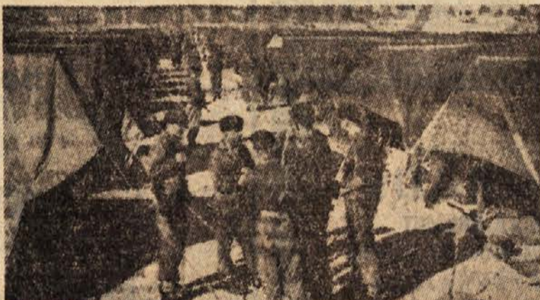
Zadnje tedne so na Ciper prispeli novi kontingenti angleških čet. Na sliki vidimo vojaško taborišče v bližini glavnega mesta Nikozije. Vojaki so našli svoja bivališča pod platnenimi strehami vojaških šotorov