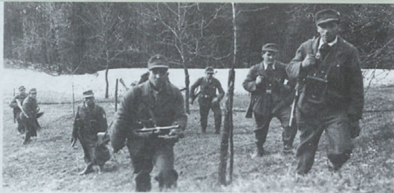
Na pohodu - fantje iz Sopotnice

»osvoboditeljev.« Ob neki »hajki,« ko smo jo ubrali čez drn in strm, sem zavil na stran in se osvobodil »tovarišev.«