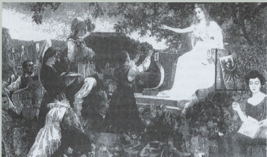
Barve slovenske narodne zastave (belo-modro-rdeča) sta na temelju barv kranjskega grba določila Anton Globočnik in Peter Kozler.

Ob koncu druge svetovne vojne, je Narodni odbor za Slovenijo, po odobritvi jugosl. begunjske vlade v tujini, potrdil kranjski grb, ki je bil/ emblem/slovenske narodne vojske.