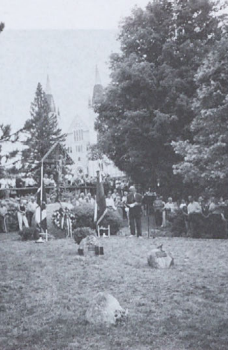
Iz proslave v Midlandu

Novi simboli, grb, zastava Natečaj (visoke nagrade, o. p.) je predložil nemoogoče modele, neprimerne tako za grb kot za zastavo. Nadalje izbiranje je trenutno zaustavljeno.