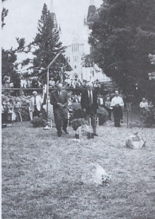
Proslava v Midlandu - Kanada

Vsi, ki poznamo resnico, moramo to resnico prenašati na novi rod, da se bo oblikoval v tako zavedne, poštene in pokončne Slovence, kot so bili ti, ki se jih posebno v teh mesecih spominjamo.