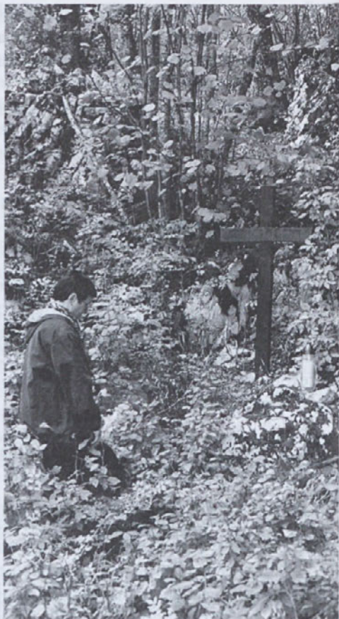
Travna gora - množično grobišče

Teharje Kočevski Rog Brezarjevo brezno Hrastnik Rov sv. Barbare Krimska jama. Zasavje Marija Reka Mozelj Jelendol Travna gora Hrovača Lajše Crngrob