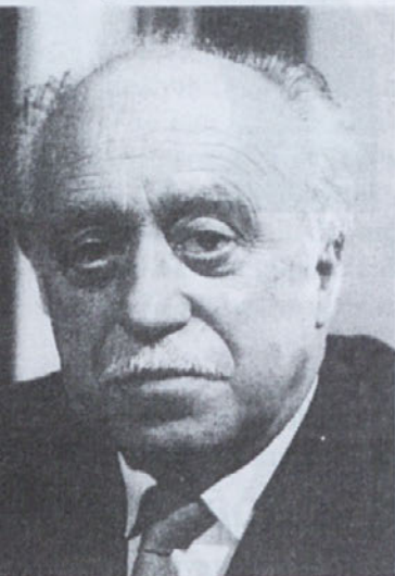
Mitja Ribičič - ubijalec na Pohorju

Zato je Mitja Ribičič pobijal partizane na Pohorju, zato so izginili primorski padalci, ki so jih Angleži poslali v pomoč partizanom.