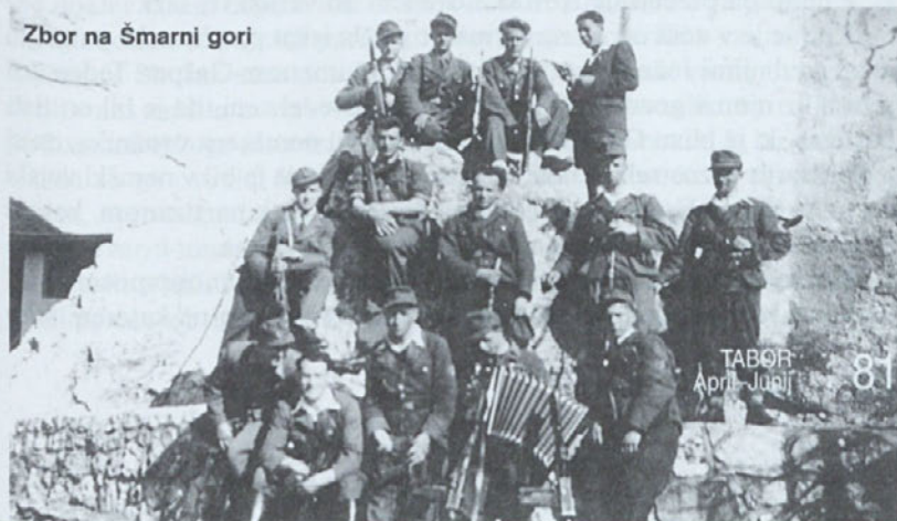
Zbor na Šmarni gori

V jurišnem naskoku smo pregnali partizane, ki niso uspeli izstreliti niti enega strela. »Bataljon« se je razkropil kot miši. Naši prvi udarni