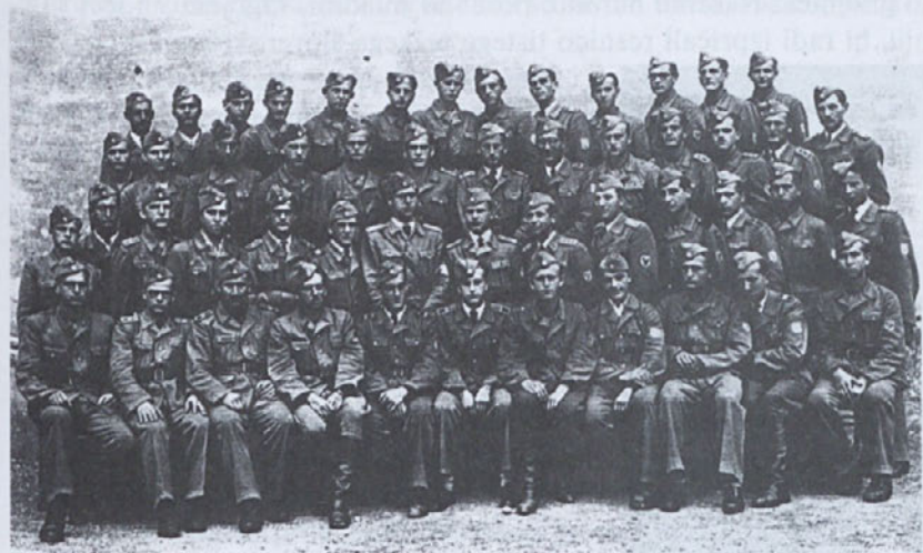
Podoficirski tečaj v Ljubljani