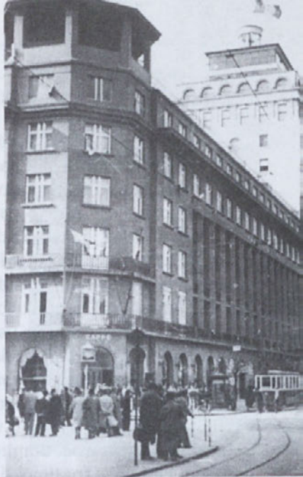
Italijanska zastava na Nebotičniku v času italijanske okupacije, 15. maj 1941