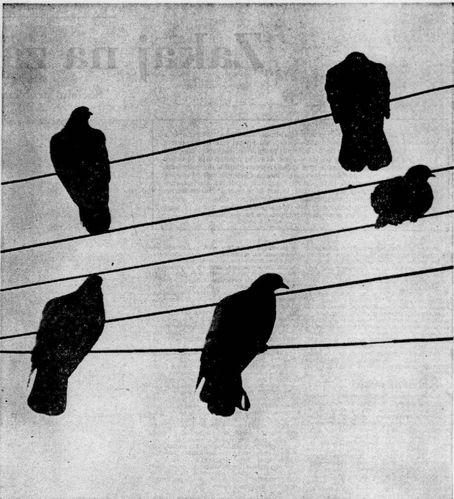
TIHOMIR PINTER: GOLOBI