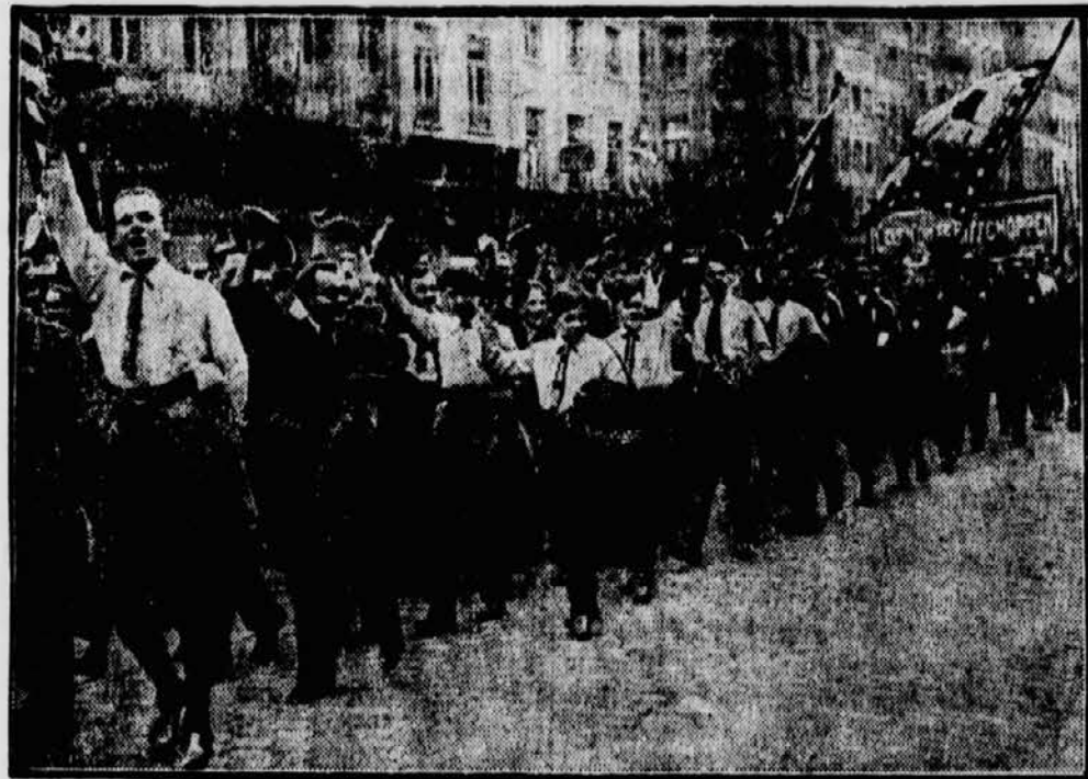
Ein Demonstrationsszug von 10.000 jugendlichen Flamen durchzieht die Straßen Antwerpens um ihren Protest gegen eine Regierungsmassnahme zum Ausdruck zu bringen.