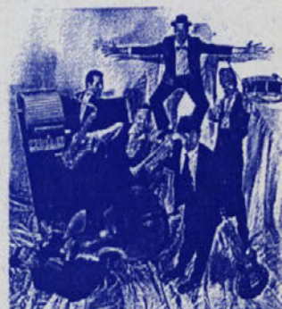
The Handsome Harry Company