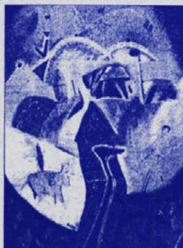
Melana tehnika/platno, 110x150 cm Tecnica mista su tela, 110x150 cm