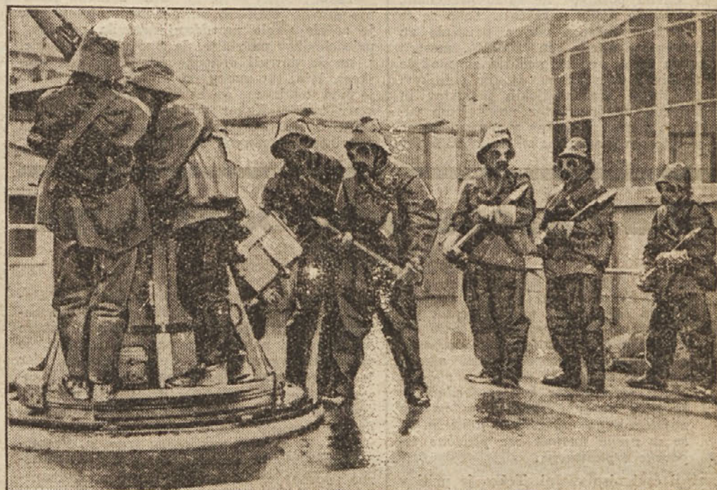
Vaje angleške mornarice

V Hollywoodu so priredili poseben prometno vzgojni teden, da bi meščane in meščanke naučili oprezne hoje po mestnih ulicah. Seveda so sodelovale tudi pripadnice filmske umetnosti.