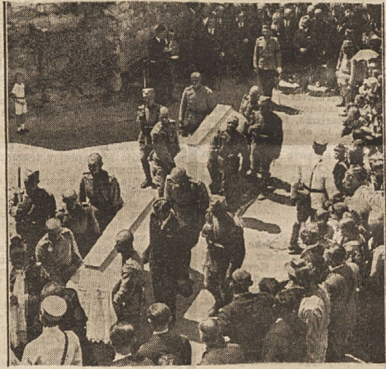
Prenos neznanih branilcev Beograda v Kostnico pri cerkvi Ružice v Beogradu.

ostane grad v današnjem stanju. Zavedamo se pa prav tako, da morajo biti stroški za bodoče namere gradu v nekem sorazmerju s stroški za nakup. Mestna občina je dala za grad nekaj nad tri milijone in sedaj bi morala dati, da preseli del magistratnih uradov, pet milijonov, znaša to nad 8 milijonov dinarjev in Maribor stalnega magistrata še niti imel ne bo. To so za današnje čase, ko kričijo po rešitvi naše šole, naša tržnica, naše ceste itd. previsoke vsote za nekaj, kar ne prinese Mariboru ničesar. Če se že misli na nov magistrat, potem se naj pripravljajo sredstva za moderno zgradbo, ki bo res sprejela vse magistratne urade in ki bo času in upravnim svrhom primerna in ki bi svoje naloge mogla izvrševati tudi v najoddaljenejši bodočnosti. Grad sam pa se naj v bodočnosti uredi tako, da bodo stroški za adaptacijo čim manjši, poleg tega pa, da bo imel Maribor od njega tudi kake koristi, če že ne direktno pa vsaj indirektno. Misel stalne vinske poskušnje je samo krilatice, ki pomaga iz zadrege tistemu, ki ne ve prav kaj početi s kletmi. Pri jasnem pojmovanju bi zamogli reči samo: stalna vinska razstava ali vinska in sadna borza ali nekaj po-