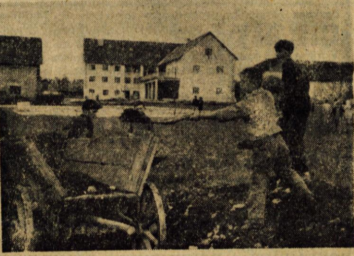
Nekaj cerkljanskih pionirjev smo zatekli prav v času, ko so z vso vnemo urejali del novega igrišča. Več o njihovem delu bomo napisali v prihodnji številki »Glasa«.