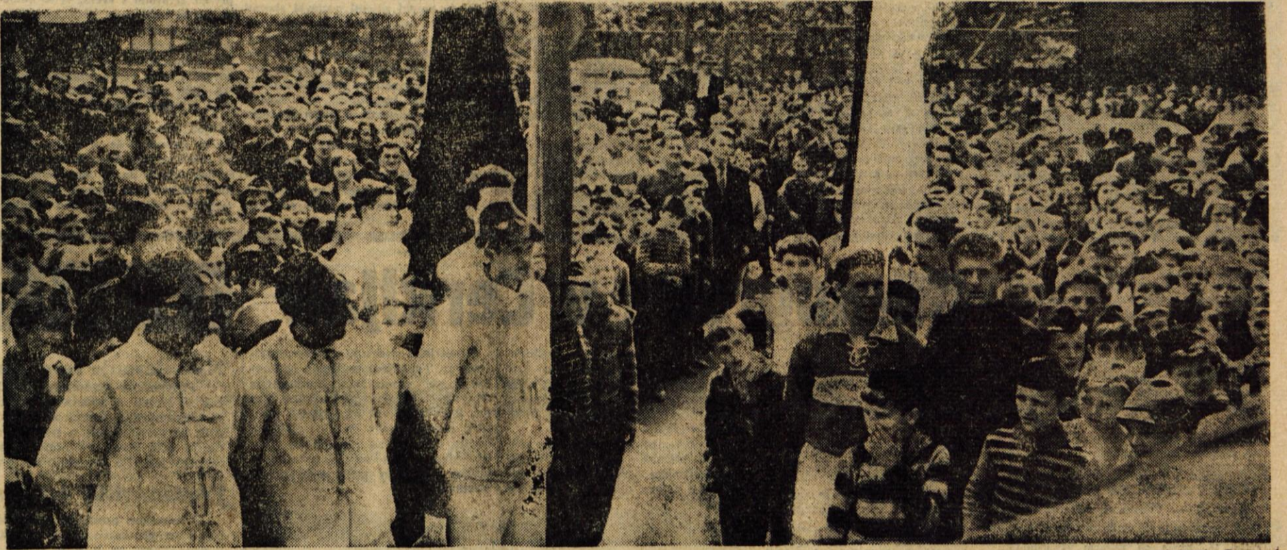
NA JESENICAH JE ŠTAFETO MLADOSTI SPREJELO NAD 3000 DOMAČINOV

Pristojnosti krajevnih odborov so torej tista točka, okrog katere se vrte novi statuti občinskih ljudskih odborov. Mnenja smo, da ne bi zgrešili, če bi dejali, naj krajevni odbor rešuje vse tiste probleme, ki se nanašajo neposredno na njegov teritorij, seveda ob upoštevanju, da ti nimajo vpliva na življenje in razvoj ostale komune. Občinski ljudski odbori pa naj odločajo in sklepajo le o tistih zadevah, ki so stvar vse komune, skratka, krajevnim odborom je treba dati pri reševanju krajevnih potreb proste roke.