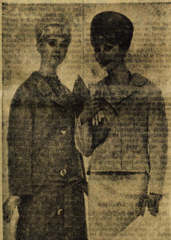
Se vedno je tu sezona splošnih plaščev in kostimov, čeprav ne bo dolgo, ko se bodo umaknili lahkim poletnim oblekam.