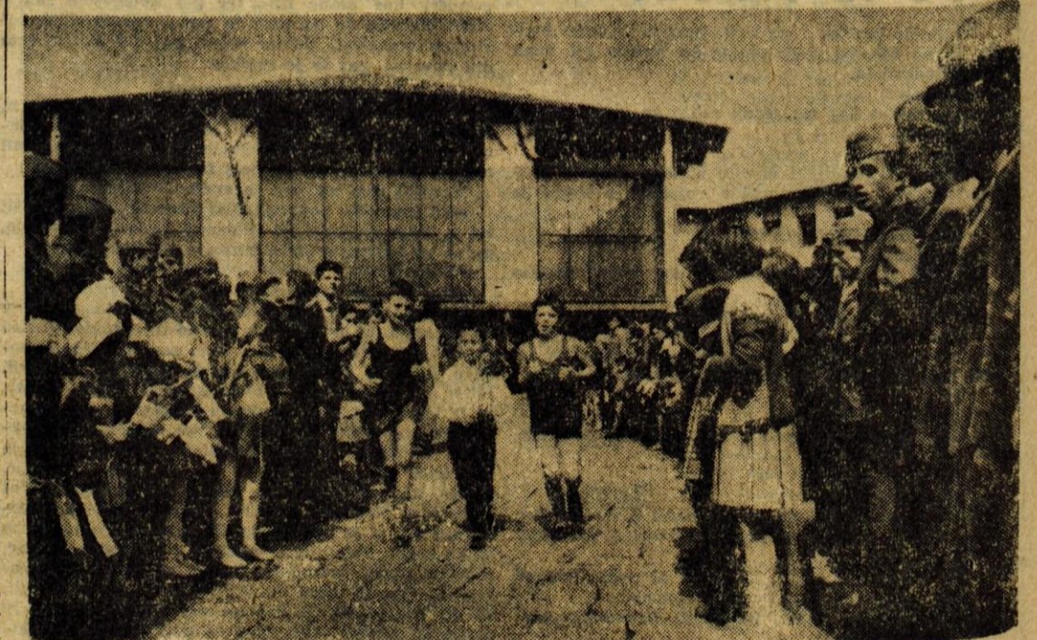
Nekaj pred 14. uro včeraj so pionirji že odnesli štafeto iz Kranja

Bled — Tu se že pripravljajo za letošnje veslaške prireditve. Mladi veslači v četvercih, osmercih in drugačnih tekmovalnih čolnihih že kar pridno krepijo svoje moči in urijo sposobnosti z upravljanjem vesel. Tekmovalni veslaški program predvideva za letos vrsto različnih domačih in mednarodnih tekmovalj. — Prvo pomembno tekmovanje bo že 1. maja. Takrat bo na sporedu poskusna regata. 1. in 2. julija pa bo na Blejskem jezeru XI. mednarodna veslaška regata. Za 8. julij je predviden veslaški troboj (mladinski) Koroška, Trst, Slovenija. 8. julija pa bo slovensko prvenstvo.