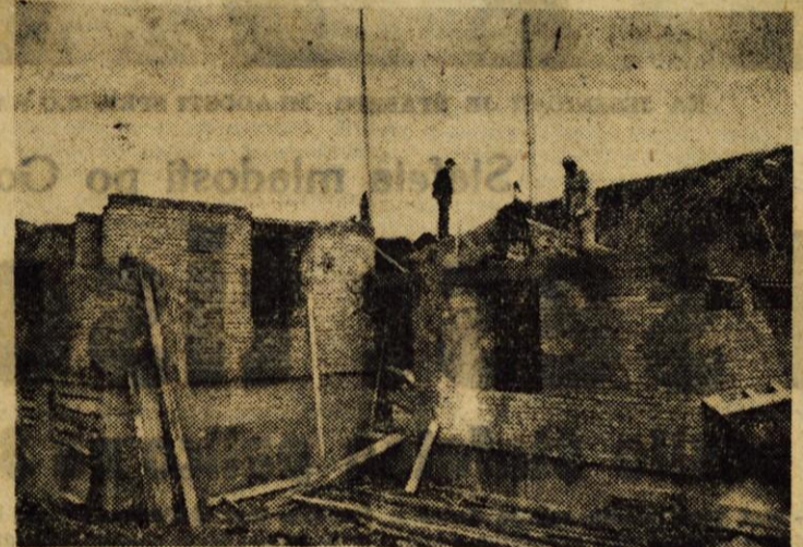
Stanovanjski blok v Cerkljah bi bil prav gotovo vseljiv to zimo, saj je Obrtno podjetje Cerklje že pripravilo vse potrebne gradbene elemente, toda sedaj ne morejo dobiti potrebne opeke in to delo močno zavira; zna pa se tudi zgoditi, da ga bo povsem zaustavilo.

Kmetijska zadruga, Obrtno podjetje in Trgovsko podjetje iz Cerklj, so imeli do nedavnega skupno sindikalno podružnico. Toda, ker vsako od omenjenih podjetij zaposluje 30 do 40 delavcev, so se odločili za samostojne podružnice. Imeli so že ustanovne občne zbornice in prve seje novih odborov.