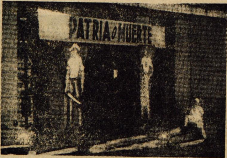
»Domovina ali smrt« je vodilno geslo v Kubi. Takšna parola je tudi nad vhodom Konfederacije kubanskih delavcev, pod njo pa sta naslikana kmet in delavec