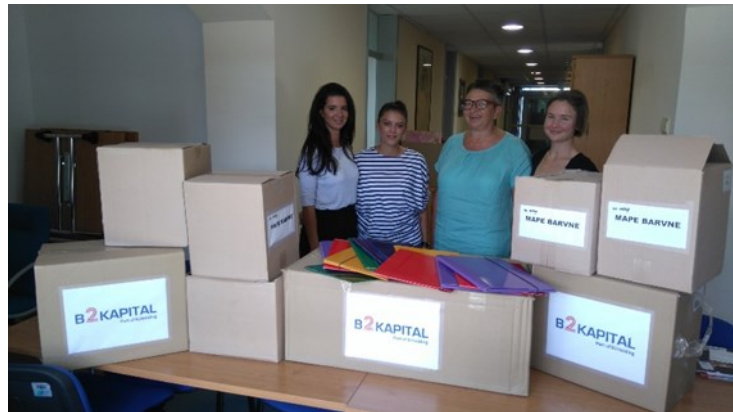
Donacija B2 Kapital d.o.o

Šolske potrebščine smo razdelili našim društvom in zvezam po Sloveniji, ki so poskrbeli, da bodo zvezke, pisala, torbice, ustvarjalne komplete, barvice,... prejeli otroci iz socialno šibkejših okolij. Mnogim staršem in otrokom bomo s tem polepšali začetek šolskega leta in zmanjšali stroške nakupa šolskih potrebščin ob začetku šole.