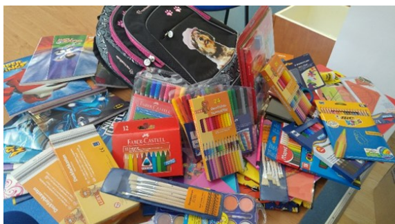
Donacija KPMG d.o.o.

V začetku meseca julija so zaposleni v podjetju KPMG d. o. o. ponovno zbrali različne šolske potrebščine. V avgustu pa so se akciji zbiranja šolskih potrebščin pridružila podjetja HETA Asset Resolution, Lidl Slovenija d.o.o. k.d ter B2 Kapital d.o.o.