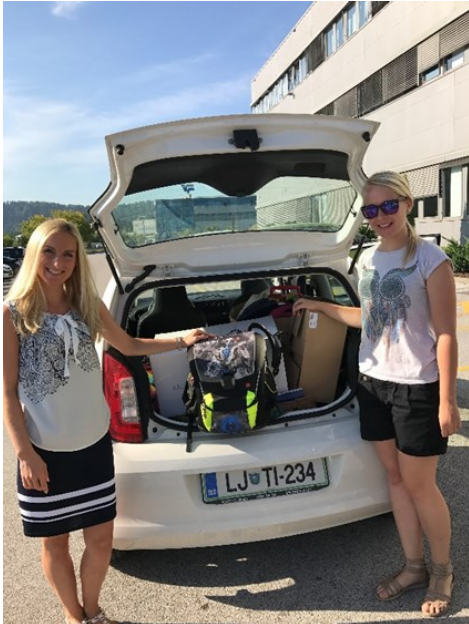
Donacija Lidl d.o.o. k.d.