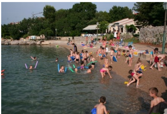
Utrinek - razposajenost otrok na obali in vodi

Brezplačno letovanje so 28 otrokom omogočili RK Domžale in različni donatorji, ki se jim ob tej priložnosti iskreno zahvaljujemo, da so lahko z njihovo pomočjo preživeli na morju nepozabne počitnice.