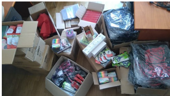
Donacija HETA Asset Resolution, družba za financiranje d.o.o.