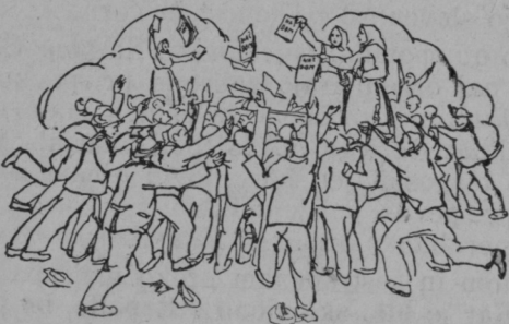
Tako delajo naša zavedna dekleta za »Naš dom«.