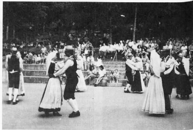
KD »Primorsko« z Mačkolj je od 24. do 29. priredilo dobro obiskano šagro. Med drugimi sta nastopili irsko glasbeno-plesna skupina All Sett in folklorna skupina Karel Pahor iz Pirana