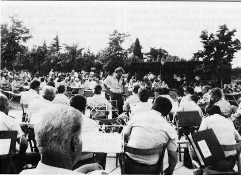
Na Proseku se je v nedeljo, 26. t.m., zaključil vaški praznik, ki sta ga priredila moški pevski zbor »Vasilij Mirk« in domače godbeno društvo. Nastopili so tudi godbeniki znanega tržaškega pihalnega orkestra »Refolo«