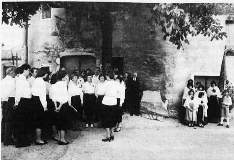
Junija 1985 so na Padričah pred Kraljevim stebrom odkrili »kamniti stol«. Ob tej priložnosti je pel domači zbor društva »Slovan«

Zgodovina društva »Slovan« se začne z valom narodnega prebujenja, ki je zajel primorske Slovence pred sto leti. V tistem obdobju so nastale številne kmečke čitalnice. Leta 1887 pa so na Padričah dali pobudo za ustanovitev pevskega in bralnega društva »Slovan«, ki je bilo duhovno povezano s političnim društvom »Edinost«. Kulturno-prosvetno delovanje na Padričah se je začelo z vso vsmo in navdušenjem, bilo je izredno aktivno in vaščani so radi sodelovali pri njem. Kot podatek naj omenimo, da so bili domačini zelo podjetni tudi na gospodarskem področju, saj so ob koncu prejšnjega in v začetku te-