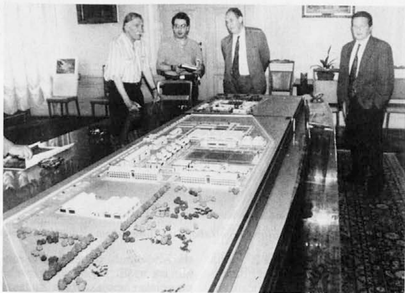
Načrt šole za finančne stražnike, ki so ga predstavili prejšnji teden, je na ogled v veži županstva v Gorici

Občinskemu svetu iz Gorice je na ponedeljkovi seji, 27. t.m., uspelo, da je vsaj odložil na september odločitev o gradnji šole za finančne stražnike v Štandrežu. S tem je preprečil poskus nekaterih sil, ki so hotele, tako vsaj kaže, čimprej »izsiliti« dovoljenje. Za odložitev razprave so se izrekle vse stranke, razen redkih izjem — posameznikov.