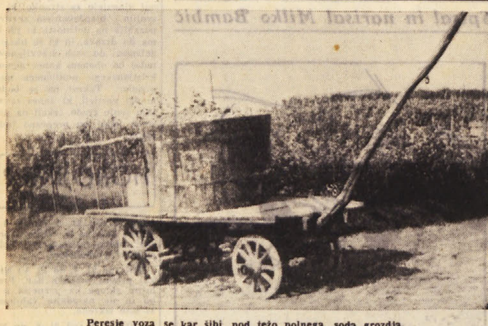
Peresje voza se kar sibi pod težo polnega soda grozjda.