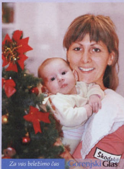
Za vas beležimo čas