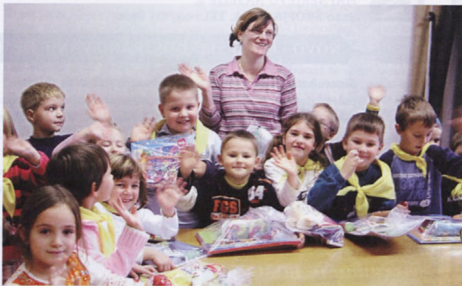
Pirniški učenci so se zelo številno odzvali na dobrodelno akcijo Otroci otrokom.

Pretekli mesec so učenci OŠ Pirniče sodelovali v dobrodelni akciji Otroci otrokom. Zbirali so darila za sirote v Romuniji in Bolgariji.