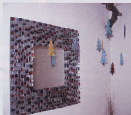
Njeni izdelki so resnično nekaj posebnega.