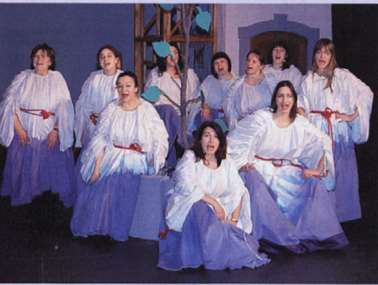
Strokovna žirija je na Čufarjevih dnevih najbolje ocenila Parlamentarke.

Pirniče - V Gledališču Toneta Čufarja na Jesenicah je potekal 19. festival ljubiteljskih gledališč, na katerega se je prijavilo kar 27 predstav, od katerih so jih za teden dni trajajoč festival, ki je potekal med 14. in 19. novembrom, izbrali sedem. Med njimi so bile tudi Parlamentarke v izvedbi KUD Pirniče - Oder treh herojev in v režiji Petra Militareva .