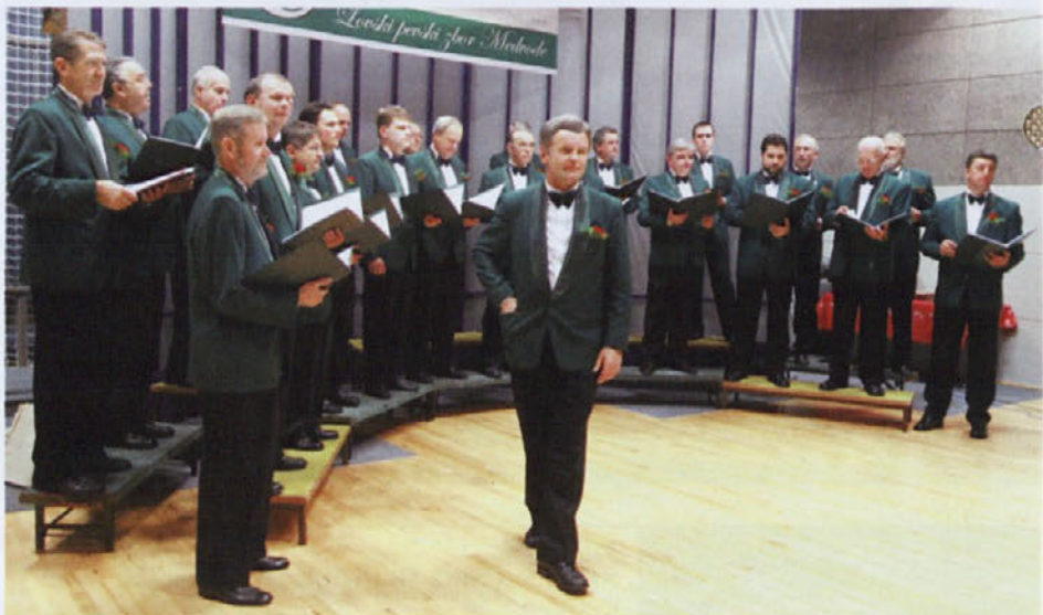
Lovski pevski zbor Medvode je slovensko pesem mnogokrat ponesel v tujino, nazadnje v sklopu letošnje jubilejne turneje po vzhodni Evropi.