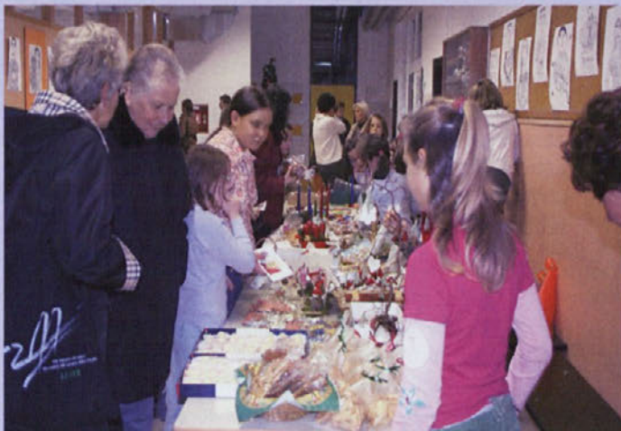
Izdelke na Miklavževem sejmu so starši pokupili v pičlih 15 minutah.

Medvode - Prejšnji četrtek so na OŠ Medvode pripravili zdaj že tradicionalni Miklavžev sejem, na katerem s prodajo izdelkov skušajo zagotoviti čim več sredstev za šolski sklad. Slednji omogoča, da se tudi učenci iz socialno šibkejših družin lahko udeležijo zunajšolskih dejavnosti. Učenci cele šole so s pomočjo staršev in učiteljev izdelovali lične voščilnice, adventne in aromatične venčke, obeske, lesene pručke, glinene angelčke, ptičje hišice, mila, novoletni nakit, Miklavževe medvedke ... Poudarek je seveda na naravnih materialih, ki so