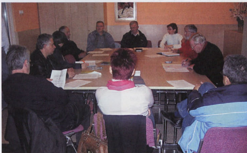
Predstavniki svetniških skupin v Medvodah so se srečali na delovnem sestanku, kjer so razpravljali o predlaganem projektne povezovanju.

Na srečanju so pojasnili, da je za približno 65 odstotkov proračunskega denarja poraba že določena in da bi v okviru projektne povezave