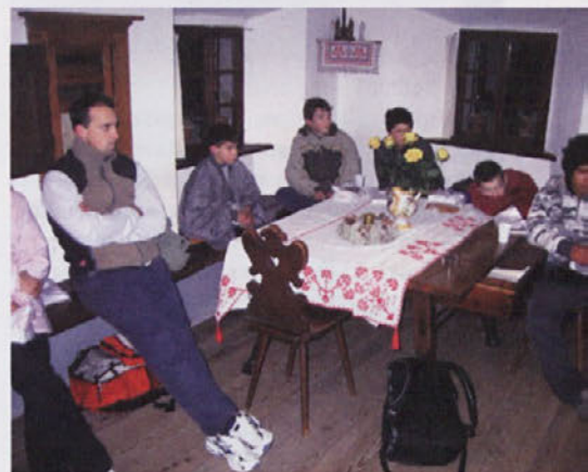
Večina udeležencev pohoda iz VIZ Smlednik je bila v soboto prvič v Prešernovi rojstni hiši v Vrbi.