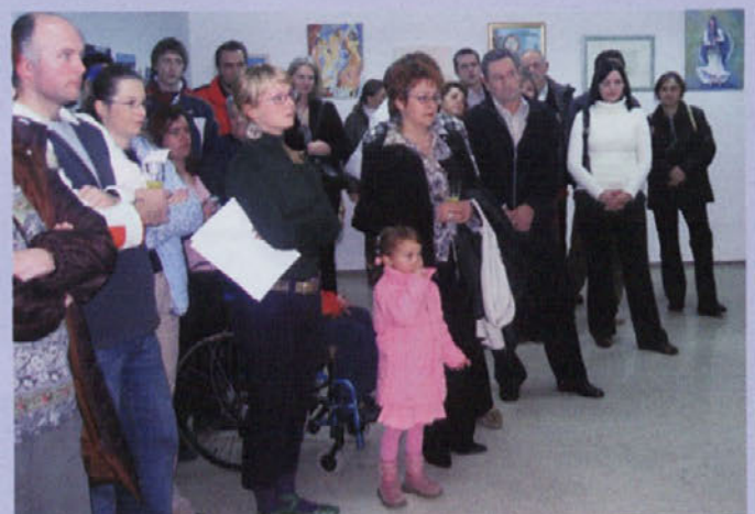
Na odprtju razstave se je zbralo veliko ljudi.