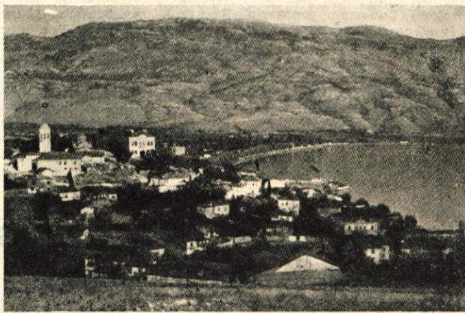
Ob Ohridskem jezeru

Odšli smo pogledat Opero in zvedele, da tisti večer predva-