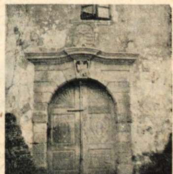
Portal Detelovega gradu v Stražišču iz 17. stol.

predvideno gostovanje v Trbovljah. Pevska vez med Trbovljani in Jesenicami je namreč prav tako globoka kot delavska vez, ki družji zasavskega rudarja in jeseniškega železarja že več desetletij. Zbor ima upanje, da bo s pričetkom nove sezone pridobil tudi nove pevce in pevke, da bo še številnejši in da bo z načrtnim študijem dosegel v letošnji sezoni tisto kvaliteto raven, ki delavskim Jesenicam pripada. Pri uresničevanju lepih načrtov mu želi naše uredništvo mnogo uspehov.