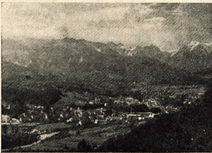
Pogled na Kamnik

Razstava ne bo samo zanimiva, ampak tudi poučna. Tovarne bodo prikazale razvoj svoje