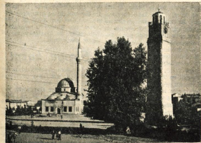
V Makedoniji je veliko džamij z vitkimi minareti

dežja in so polja umetno nakalila. To je bilo ravno tisti čas, ko so bile pri nas take poljave. Suša je tam doli sploh zelo pogosta in namakanje polj, ki je znano še iz zgodovinskih časov, je sedaj že mehanizirano. Pozneje smo v okolici Ohridskega jezera videli, kako je deček poganjal velikansko kolo, podobno mlinskemu kolesu in tako iz rezervoarja spravljal vodo v jarko. V muzeju so nam pokazali delovanje take priprave, kjer so imeli v miniaturi izdelan ves namakalni sistem.