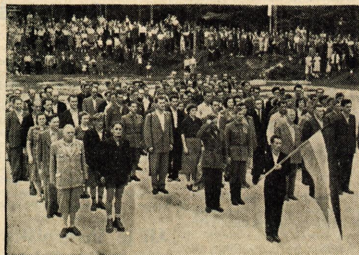
Borci Jeseniško-bohinjskega odreda in VDV-bataljona na parti-zanskem slavlju v Bohinju 22. 8. 1954

Tudi občinske ceste nismo zanemarili. Kar lepo število kilometrov smo lani in letos popravili. Finančna sredstva smo črpali nekaj iz gozdnega sklada, več pa so prispevali kmetje in pa seveda občinski odbor. Za prihodnje leto imamo cel kup načrtov in želja, vendar o tem ne bi rad sedaj govoril, ker ne vemo koliko bomo imeli denarja za investicije in kaj bo res najbolj potrebno. O tem bomo morali še razpravljati in šele potem vam bom lahko kaj več povedal.