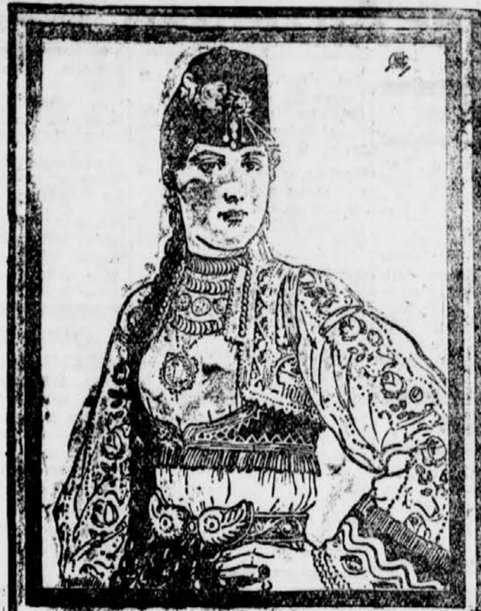
Die schöne Rosniakin