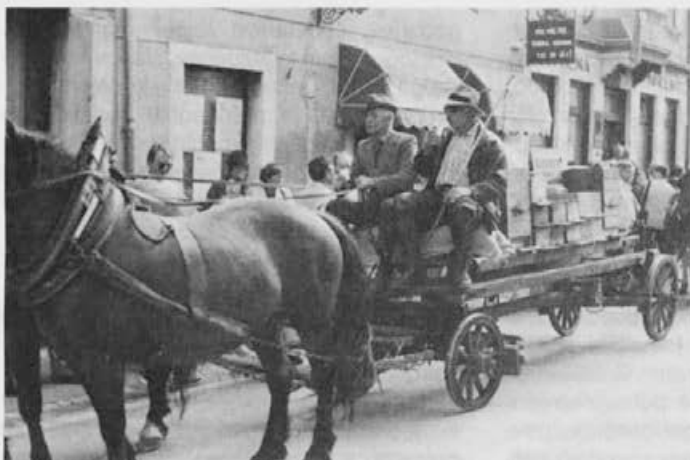
Čebelarški voz na ribniškem sejmu.

G. Viktor Kladnik je ribniške čebelarje povabil v Sevnico na proslavo ob 60. obletnici Čebelarskega društva Sevnica in na državno tekmovanje mladih čebelarjev, ki