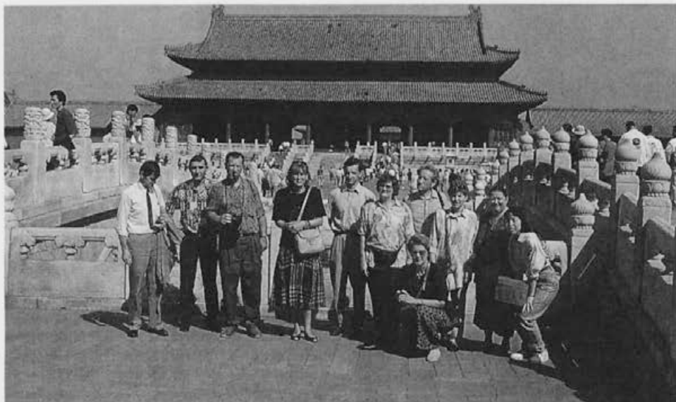
Skupni posnetek delegacij novih članic Apimondije Slovenije in Hrvaške pred cesarsko palačo v prepovedanem mestu v Pekingu.