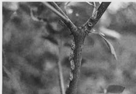
Škržati v vrsti. Tako je ponavadi od začetka julija do jeseni.

pojavele tudi prve večje težave. Tamkajšnji čebelarji so se kot vedno dobro organizirali in dogovorili o posebnem pašnem redu na škržatovi paši, letos pa je pri reševanju problemov sodelovala tudi služba opazovanja in napovedovanja medenja. Strasti so se nekoliko umirile, saj je bilo od Mirnskega gradu do Nove Gorice toliko čebel kot vojaške tehnike v času soške fronte.