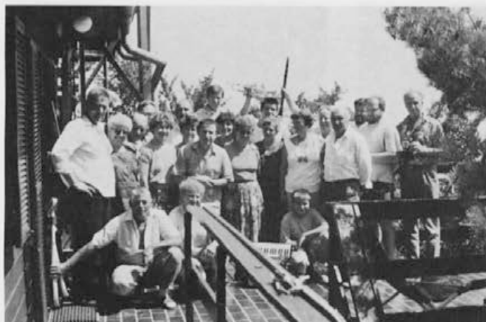
Čebelarji ČD Rače na radarskem centru proti toči na Lisci. Med njimi je tudi čebelar strelec proti toči št. 40.