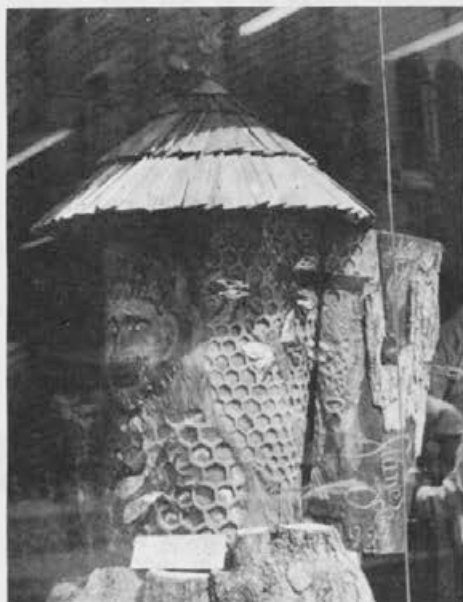
Lepo izrezljan lesen panj, delo Staneta Zobca iz Ribnice.