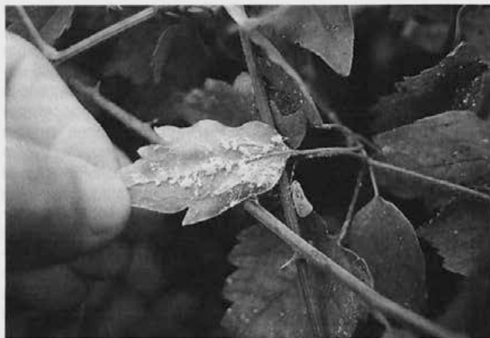
Škržat na vejici in mlada kolonija pod listom.

lista« prestopil mejo s Slovenijo. To leto so v Vidmu (Udine) dvakrat točili škržatovo mano in dobili še ozimnico. V tem času so naši čebelarji blizu meje na Goriškem prvič opazili nekaj donosa in nato uspešno prezimili čebele. Leta 1992 pa je izbruhnila prava mrzlica, tako da so se na precej prenasičenem pasišču v novogoriški občini