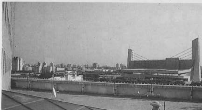
Pogled s Kongresnega centra na hitro se razvijajoči Peking.

Naj v začetku s čebelarskega vidika predstavim državo-gostiteljico. Kitajska ima 7,5 milijona čebeljih družin oziroma več kot 13 odstotkov vseh čebeljih družin na svetu. Na leto pridelajo 208.000 ton medu. Pridelajo tudi več kot 1000 (tisoč) ton matičnega mlečka, 800 ton cvetnega prahu in 3.000 ton voska. Pridelujejo tudi čebelji strup, vzrejajo trotovske in čebelje ličinke, ki jih