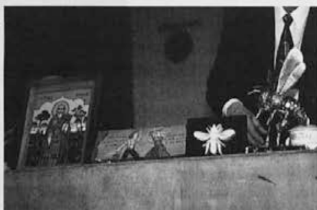
Med drugimi darili predsedniku Apimondije dr. Bornecku je bila tudi naša panjska končnica.