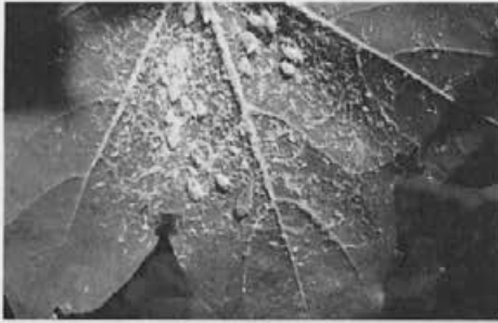
Lepo vidna kolonija škržatovih mladice