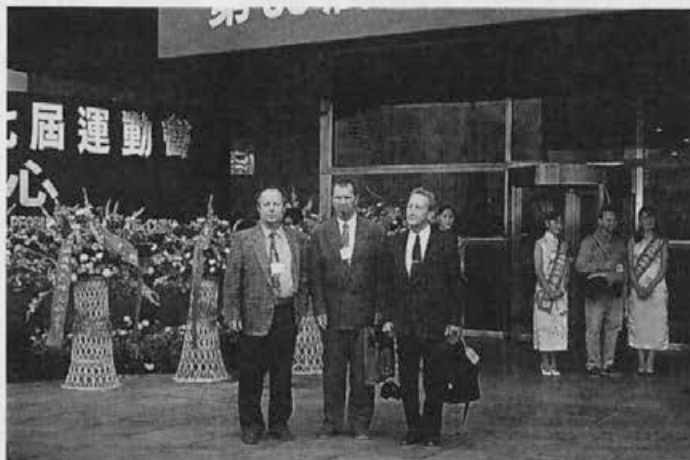
Slovenska delegacija pred kongresnim centrom, kjer je bil kongres Apimondije.

cije – na njej so sodelovali predstavniki vseh članic APIMONDIJE in vsi so enotno podprli vstop Slovenije v svetovno čebelarstvo organizacijo. To je veliko priznanje za slovenske čebelarje in naše čebelarstvo, seveda pa tudi za našo čebelarstvo organizacijo. Hkrati pa nas to tudi zavezuje, da