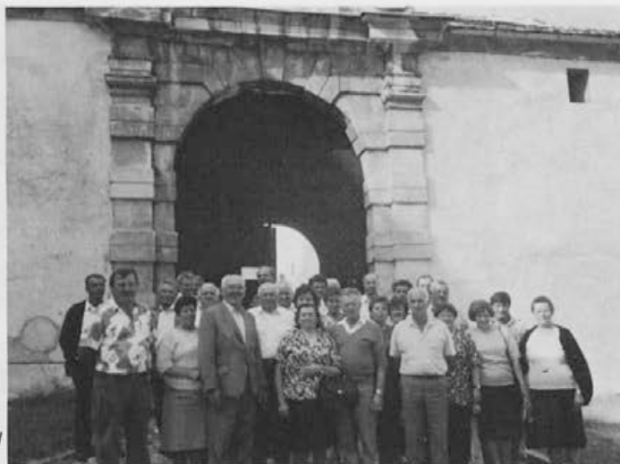
Ilirskobistriški čebelarji pred ptujskim gradom.