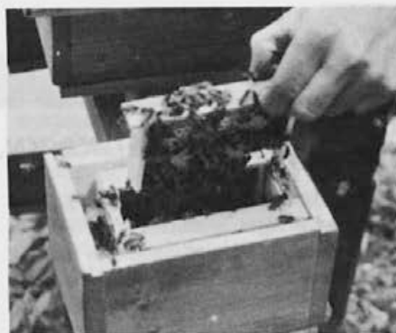
MLADE, ZDRAVE MATICE SO POMEMBNE ZA JESENSKO MOČNO DRUŽINO.

– Hlapi timola uničijo skoraj vse razvojne stadije vešče. Izjema je le stadij gosnice,