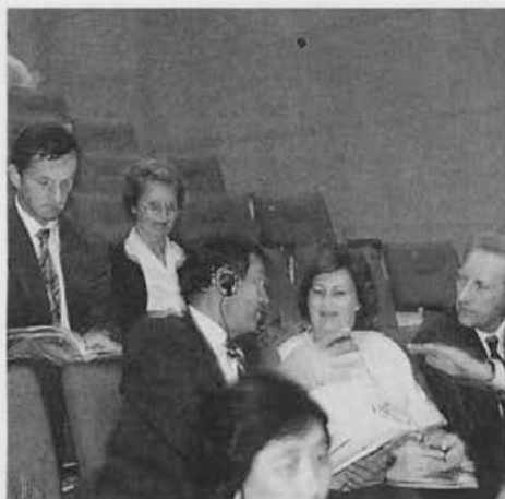
Na zasedanjih komisij je bilo prebranih veliko zanimivih referatov.