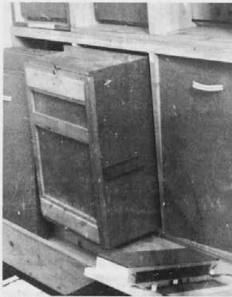
Tudi v regalih lahko namestimo zaklade.

Družine v obeh etažah so že zgradile gnezdo z 10 do 13 zaleženimi satji. Spomladi družin nikoli ne hranim s sladkorno pogačo ali drugo krmo. Raje jih jeseni izdatno dokrmim, in sicer prav s petlitrskim Francičevim pitalnim koritom. Gnezda z zalego se torej v začetku maja, ko vsaj na Gorenjskem še proti prodor hladnega zraka, nisem dotaknil. Omogočil pa sem širitev gnezda in dal čebelam več prostora za shranjevanje medicinine in obnožine. Ker je bilo na satih, prestavljenih v zaklado, še nekaj pokrite jesenske zaloge medu, sem jo z vilicami odkril ali spraskal pokrovce, tako da so te ostanke zimskih zalog čebele prenesle, porabile ali na novo predelale in ni ostala na satih za poznejše točenje. S tem sem povzročil tudi obilni umetni obtok hrane v panju, to pa spodbuja k še večjemu razvoju družine.