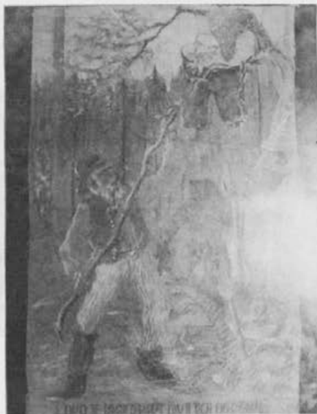
Slika z razstave v Ribnici

V Sodražici smo se poslovili od prijaznih ribniških čebelarjev in sami nadaljevali pot do Nove Štife, kjer stoji znamenita romarska cerkev sv. Marije. Cerkev je čudovit primer baročne arhitekture. V notranjosti cerkve smo občudovali izvirnost posrebnih in pozlačenih rezbarij.