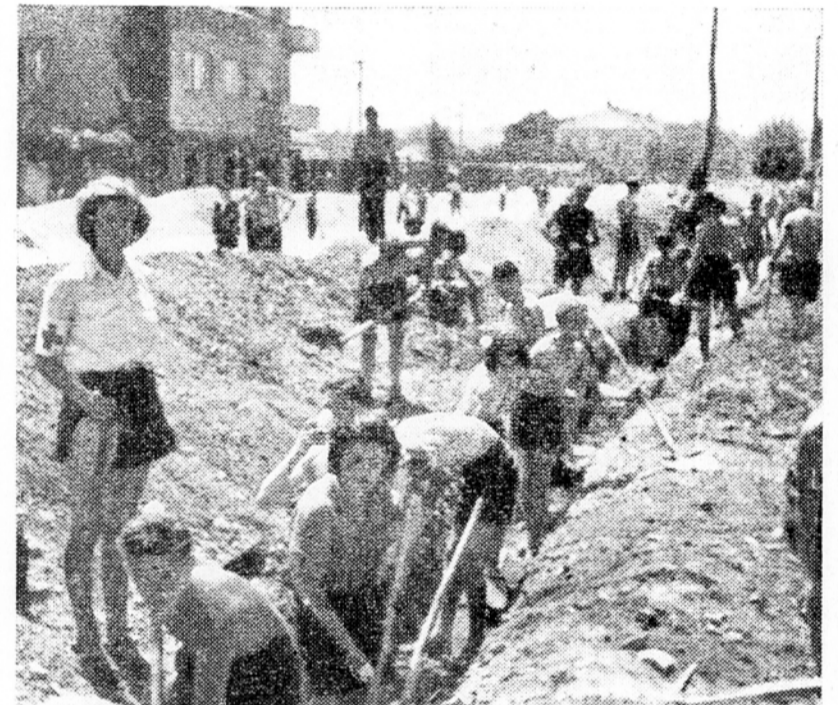
V curkih lije pot s čela in ožganih hrbtov. Tovarišica iz brigadne ambulante hodi ob jarku in streže mladim žejnim grlom

Ljubljane. Priključila pa se jim je cela vrsta fizikulturnikov FD »Svobode«, in sicer moštvo košarkar in odbojke ter nogometno moštvo Juniorjev. Brigada se razdeljena na štiri čete, ki jih vodi četni komandirji. Svoje laboratorije si je uredila na nekdanjem Stenovem kopalšču ob Savi.