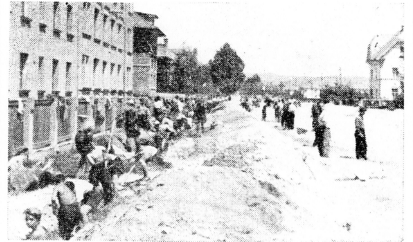
Brigada »Vere Šercerjeve« koplje na prvem odseku vodovodni jarek, kajti poleg drugih del je treba v prvi vrsti urediti vodovodno napeljavo

Dolj v jarku se zakrohote hudo-mušnež. »Meni najlj vode v čevlje, gorji na robu jarka sem jih sezul, go-