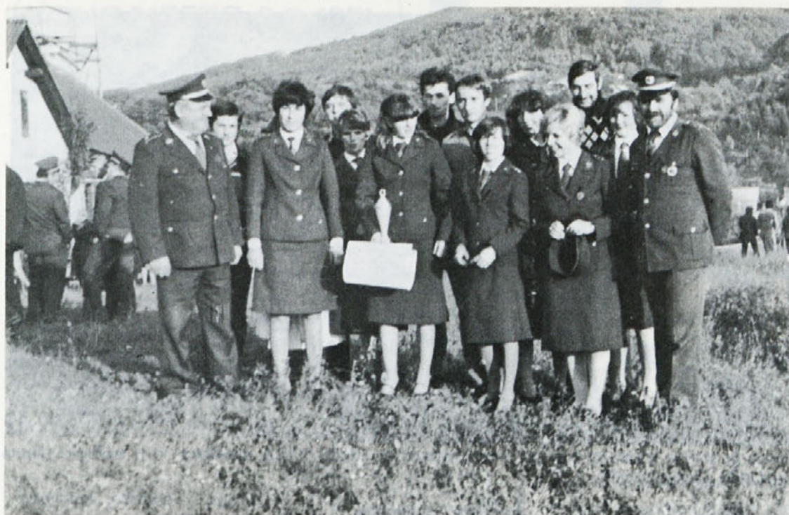
S pridnostjo, vztrajnostjo in prizadevnostjo dosegajo dekleta iz Ločne tudi na gasilskem področju lepe uspehe.