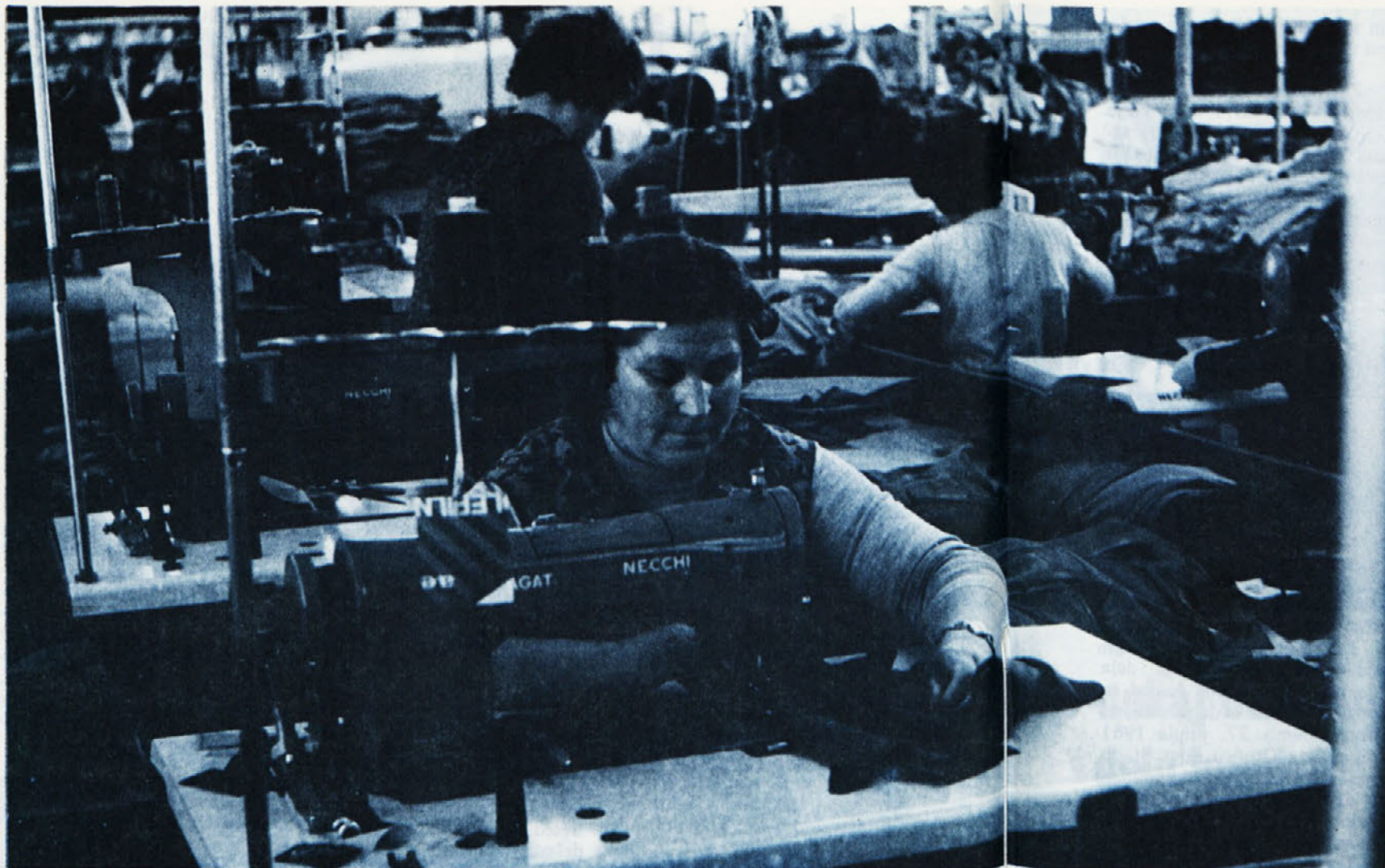
Tudi šivalni stroj mora biti periodično pregledan, da bi bilo s tem zagotovljeno brezhibno in varno delo. Posnetek iz TOZD Temenica

Nastop na Posavski pevski reviji Viteška dvorana v brežiškem gradu je 29. aprila nudila obiskovalcem nepozaben večer. Bila je gostiteljica Posavske pevске revije, ki je sprejela letos dvajset pevskih zborov vsega