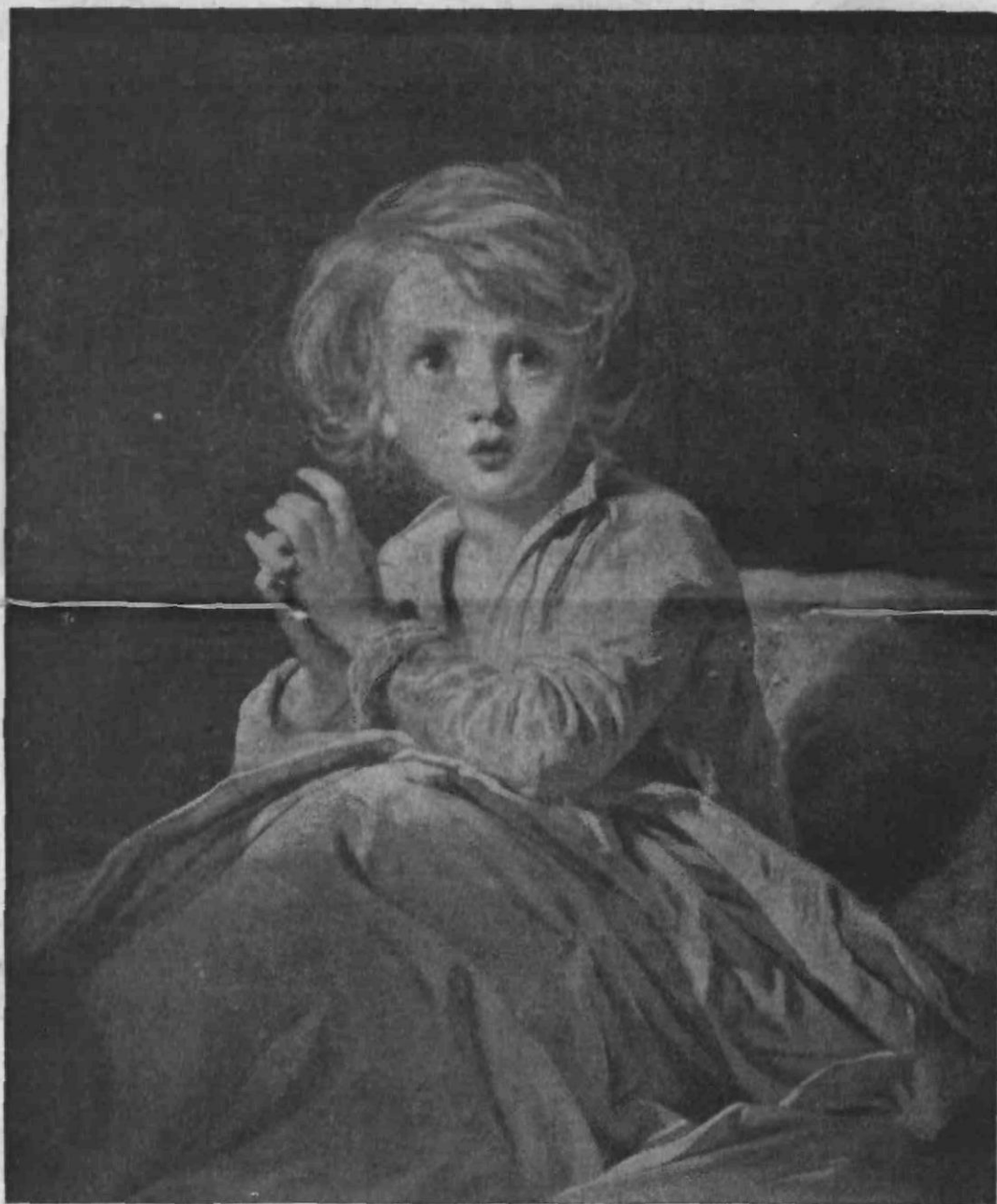
— — — — — Nedolžnost. — — — — —