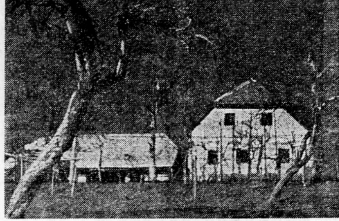
Dolenski domačija v februarjem soncu

Nekaj kilometrov oddaljeni od Selnice so na dolenski strani prijazna naselja Tržišče, Maljkovec, Gabriela, Krmelj, Sentjanž, kjer prebivajo preprosti, veseli ljudje, ki se bavijo s poljedelstvom, vinogradništvom in s delom v rudniku rjavega premoga v Krmelju, prijaznem kraju med Tržiščem in Sentjanžem, v objemu številnih gozdov in nizkih gričev, posejanih tu in tam s polji in travniki. Človek, ki pride v Krmelj s vlakom ali pa tudi peš, takoj razloži ta kraj od ostalih po ropotu rudniških vozov in lokomotiv. Krmeljski rudnik obratuje že okrog 80 let, je pa slabo mehaniziran in zaradi česar proizvodnja precej trpi. V zadnjih letih je ukinilo vodstvo rudnika za izboljšanje delovnih pogojev že precej in se razmere polagoma boljajo. Tistim, ki so videli ta kraj že v stari Jugoslaviji, ga danes bolj težko prepoznajo. Tu so v zadnjih letih zgradili več novih stanovanjskih hiš za rudarje, ki se v marsičem razlikujejo od starih, nezdarih in iz lepene kritih stanovanjskih barak, ki so jih prav tako temeljito prenovili. Obnovili so tudi med zadnjo vojno močno poškodovano nekdanjo bolnišnico, ki služi danes potrebam osnovne šole. V njej je tudi več stanovanj. Pred nekaj leti so odkrili v Krmelju spomenik, na katerem so ovekovečena imena številnih, za svobodo padlih rudarjev, in izročili svojemumu namenu lep kulturni dom, lani pa so zgradili še novostavbo, v kateri je dobila svoje prostore ambulanta.