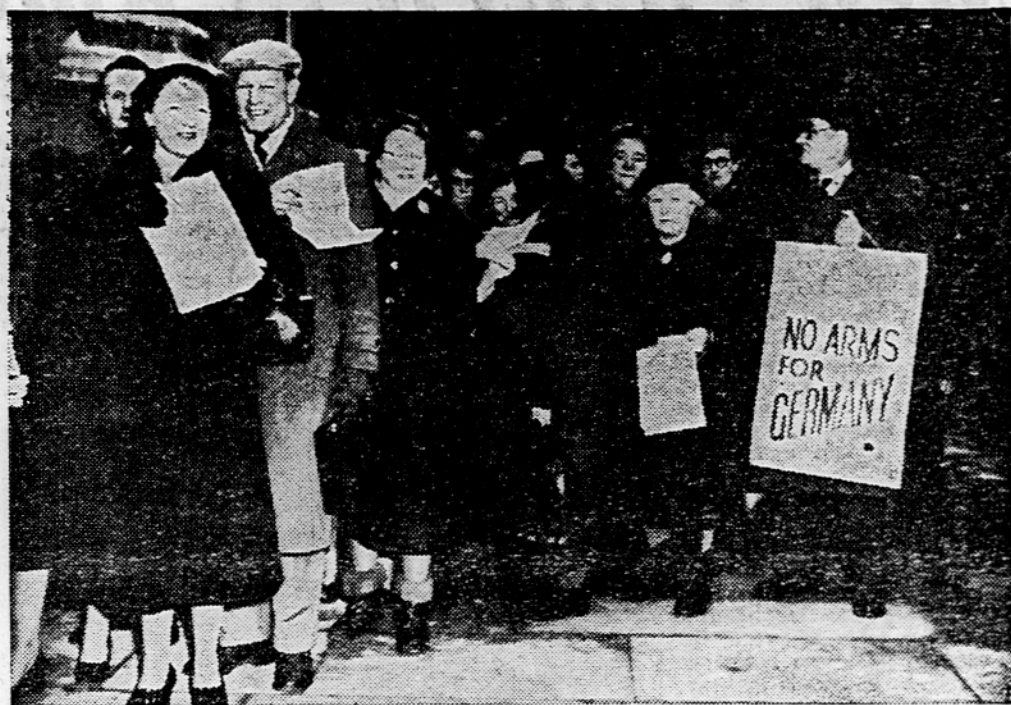
Pred dnevi so se sestale v Londonu »miroljubne delegacije« iz vseh krajev Anglije ter s transparenti in letaki protestirale proti remilitarizaciji Nemčije. Demonstranti — silka kaže skupino iz Manchesterja pred londonskim parlamentom — so zahtevali, naj pospele iz njihovih okrajev podprejo njihove zahteve