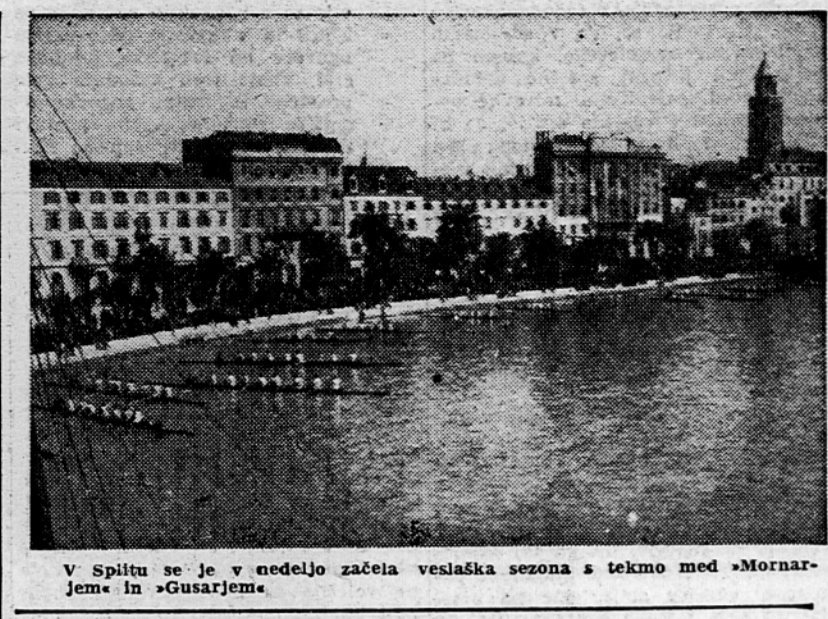
V Splitu se je v nedeljo začela veslaška sezona s tekmo med »Mornarjem« in »Gusarjem«.

Na nedavnem zasedanju delavskega sveta rudnika Trbovlje — Hrastnik se je razvila živahna debata po razpravi glavnega inženirja, ki je obravnaval perspektivni plan jamskih investicij za dobo 10 let. Po tem planu se bodo letos nadaljevala že začetna investicijska in zalivalna dela v obratu Hrastnik in Ojstro, kar bo velikega pomena za povečanje proizvodnje v teh obratih, saj se bo proizvodnja dvignila za najmanj 50%. Nadalje je v planu tudi osamoosvojitve obrata Dol v samostojen obrat. Na zasedanju so razpravljali tudi o sklepih zadnjega plenuma CK KPS o obratnih nezgodah pri podjetjih. Ugotovljeno je bilo, da so se nezgode povečale v letu 1951 za 10%. O tem so razpravljali tudi na zadnjem občnem zboru sindikalne podružnice rudarjev, kjer so bili mnenja, da je premalo za-