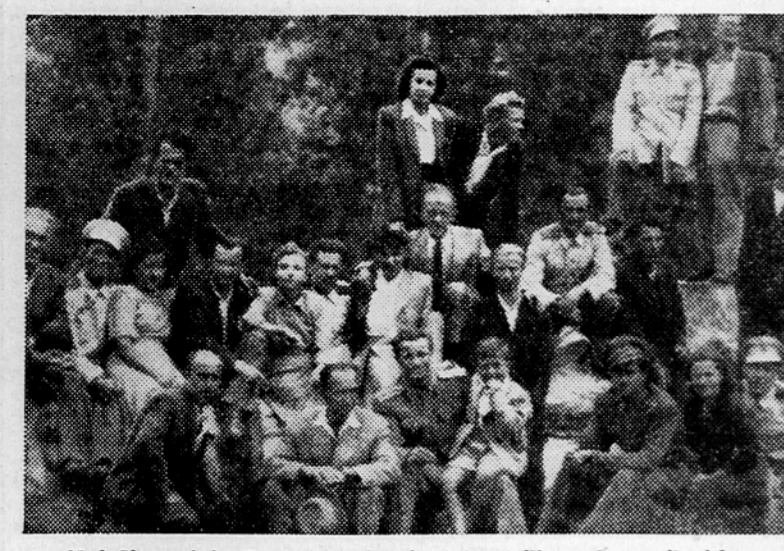
Med Slovenci in Bosanci, med vojaki in civili, se je razvilo iskreno prijateljstvo. — Naša slika kaže skupino Slovencev in Bosancev na bosanskem narodnem prazniku v Kopču in.

Odnosi med Slovenci in domačini so izredno dobri. Prav posebno ugaja domačinom, če imajo priložnost povabiti Slovence v svoje hiše, kar se zgodi navadno ob nedeljah popoldne. Proti večeru se vračajo naši ljudje v svoja