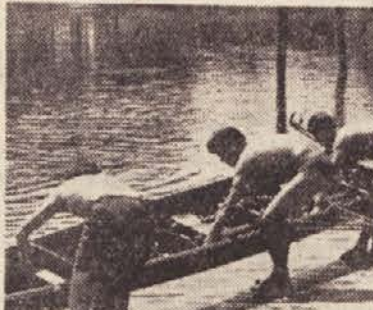
Veslači se odpravljajo na večerni trening