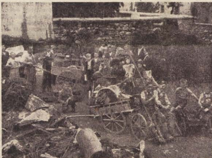
Pionirji so pripeljali staro železo

Zal pa ne vemo, kakšni so uspehi gornještajskih pionirjev, ker nimamo o njihovem delu nobenih poročil. Prepričani pa smo, da ne zastajajo za ostalimi pionirji v Sloveniji in da se bomo tudi o njih lahko pohvalno izrazili. 80.000 kg odpadkov v 14 dneh je vse-kakor lep uspeh naših pionirjev. Če bi