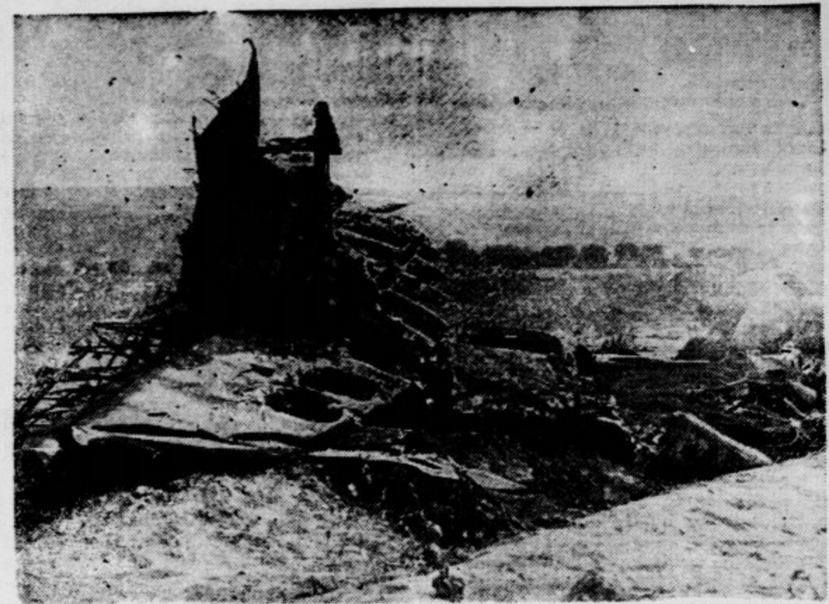
I resti di un apparecchio incursore nemico, abbattuto a Comiso — Ostanli sovražnega letala, ki je bilo sestreljeno pri Comisu

Prvi transport, ki je pripeljal v Carigrad ranjene iz Adapazarja, je obsegal 45 oseb. Večinoma so bile med njimi ženske, ki so se nahajale v trenutku nesreče v kinematografu, kjer so se tla močno zamajala pod nogami. Gledalci so takoj pritisnili proti izhodu in so se zatekli pod drevesa v bližnjem drevoredu. Toda drevesa jim niso nudila nobene zaščite. Tuli nje so potresni sunki izruvali iz zemlje in mnogo ljudi, ki so menili, da so si z begom na prosti rešili življenje, je bilo pod drevesi usmrčenih. Kinematografsko poslopje se je med potre-