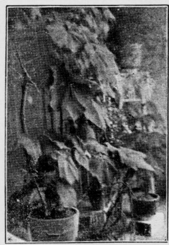
Skupina bohotno razevelih sobnih lip

Skratka, lipo pozna pri nas vsakdo, zato je ni treba podrobno opisovati. Tudi je povsod znano, da je njeno cvetje zdravil-