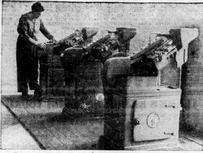
En sam delavec izdelal je avtomati, ki jih vidimo na sliki, v eni uri 18.000 navojev na vijakih.

Veliko kovinsko podjetje »Remont-Ljubljana« združuje več kovinskih obratov, raztresenih po bližnji in daljni okolici Ljubljane.