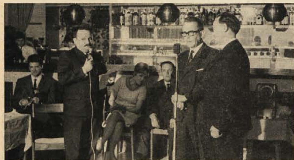
»Sefovski intervju« na lanskem novinarskem plesu

Potem sem z nogo v mavcu in bergljami prvič nastopila v začetku decembra na ustnem časopisu v Celju, nato pa tudi drugje. Mavec so mi sneli šele pred nekaj dnevi in sedaj moram nogo potrpežljivo razgibati...«