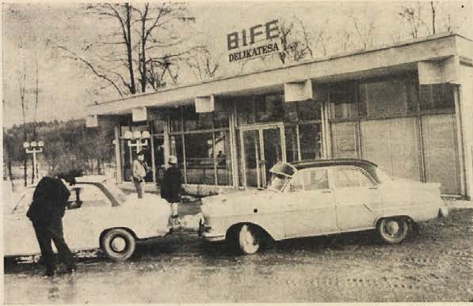
BIFE-DELIKATESA na Otočcu, ki so ga odprli tik pred novim letom, je projektiral in zgradil SGP »PIONIR« iz Novega mesta. Se ena delovna zmagala »PIONIRJA«, ki je v 20 letih zgradil po vsej Jugoslaviji več kot 2400 objektov visoke in nizke gradnje.