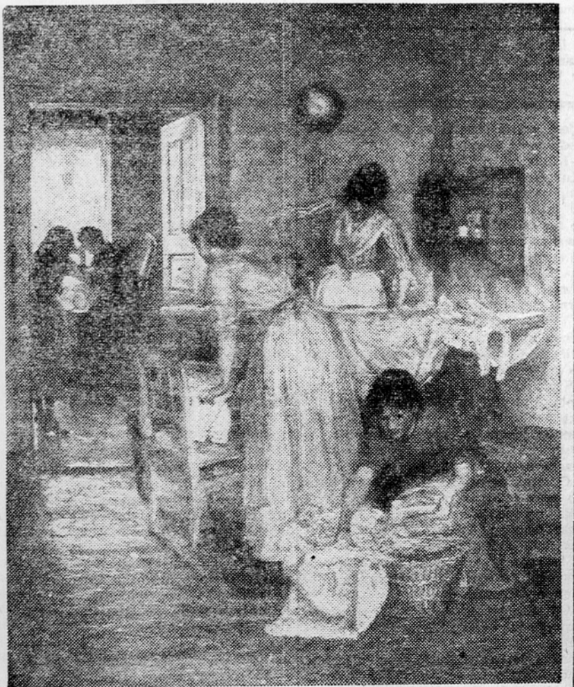
Ivana Kobilica: Likarica (slika z razstave).