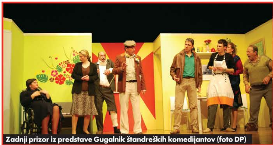
Zadnji prizor iz predstave Gugalnik štandreških komedijantov