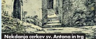
Nekdanja cerkev sv. Antona in trg Schönhaus, danes trg sv. Antona

Leta 1745 so staro cerkev porušili in zgradili novo. Dokončali so jo leta 1753. Za časa reform cesarja Jožefa II. je leta 1785 bil samostan ukinjen, redovniki pa so se preselili v Trst. Cerkev je bila porušena leta 1817. Danes nas na nekdanji samostan in cerkev spominjata stebrišče ob trgu sv. Antona in cerkva, posvečena temu svetniku.