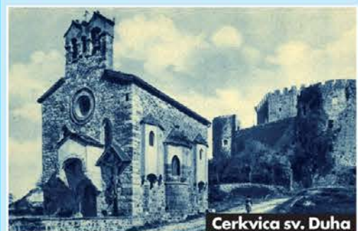
Cerkvica sv. Duha

Naselje okrog gradu, v katerem je danes nastanjen večji del goriških muzejev, je s prevzemom mestnih pravic l. 1307 postalo "gornje mesto". Tu je svoj sedež imela mestna uprava. Zato je bilo samo po sebi umevno, da so si novi meščani zaželeli v svojem, pravkar ustanovljenem mestu imeti tudi svojo