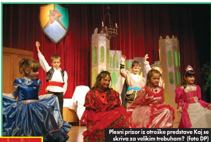
Plesni prizor iz otroške predstave Kaj se skriva za velikim trebuhom?