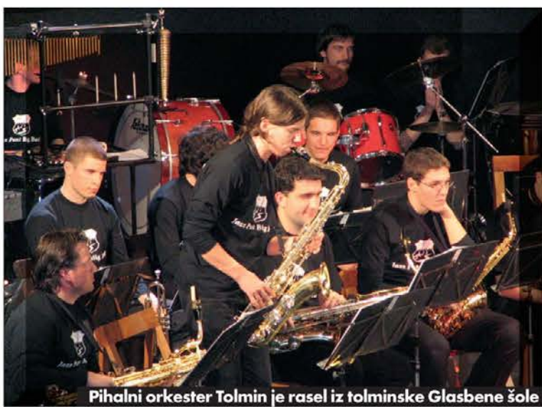
Pihalni orkester Tolmin je rasel iz tolminske Glasbene šole

tedanjih društvih (pevski zbor, tamburaški zbor, pihalni orkester). Podbrdo... Danes na šoli poučujejo devet