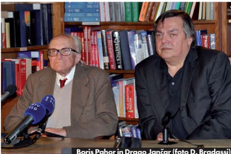
Boris Pahor in Drago Jančar

in ni bilo opaziti, da je imel pisatelj lansko leto, kot je dejal, v tujni kar 150 nastopov, na katerih, sploh italijansko mladino, vedno znova opozarja na nekatera spregledana zgodovinska dejstva. Tudi pri njih obstaja meja, preprosta, med lažjo in resnico,